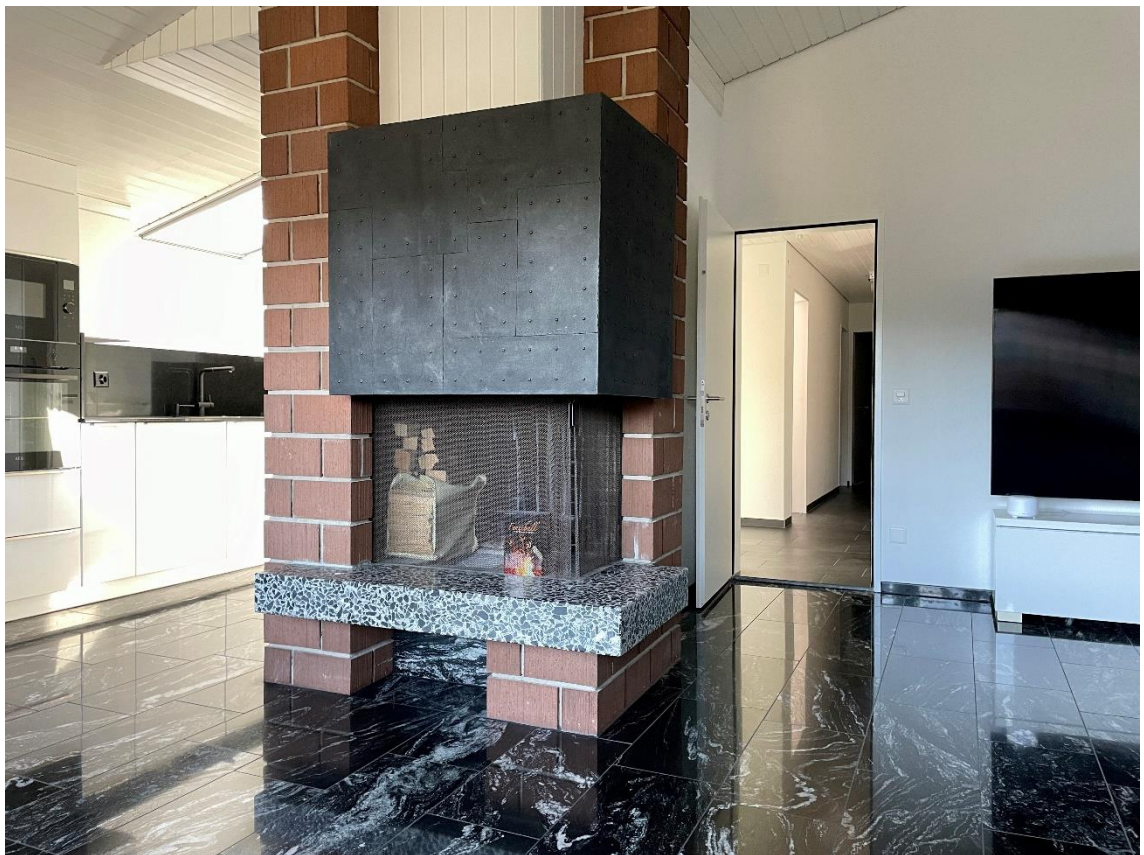
Cheminée das Herzstück der Wohnung