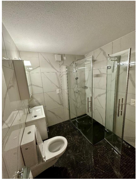
Nasszelle gross: WC/Dusche mit Vorrichtung für Waschmaschine und Tumbler