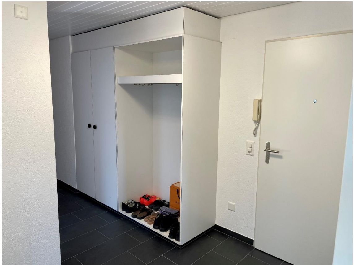
Eingangsbereich mit Garderobeeinbauschränk