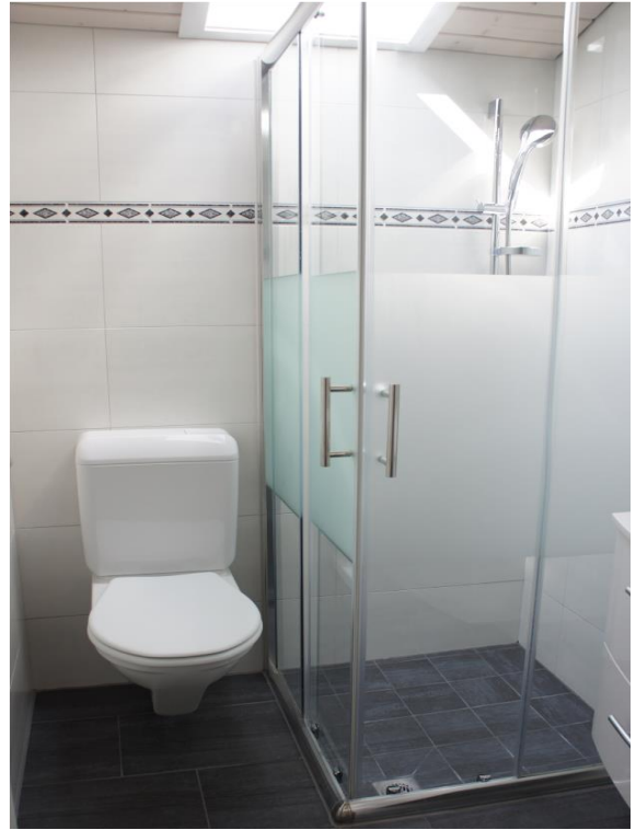
Nasszelle klein: WC/Dusche mit elektrischem Dachfenster