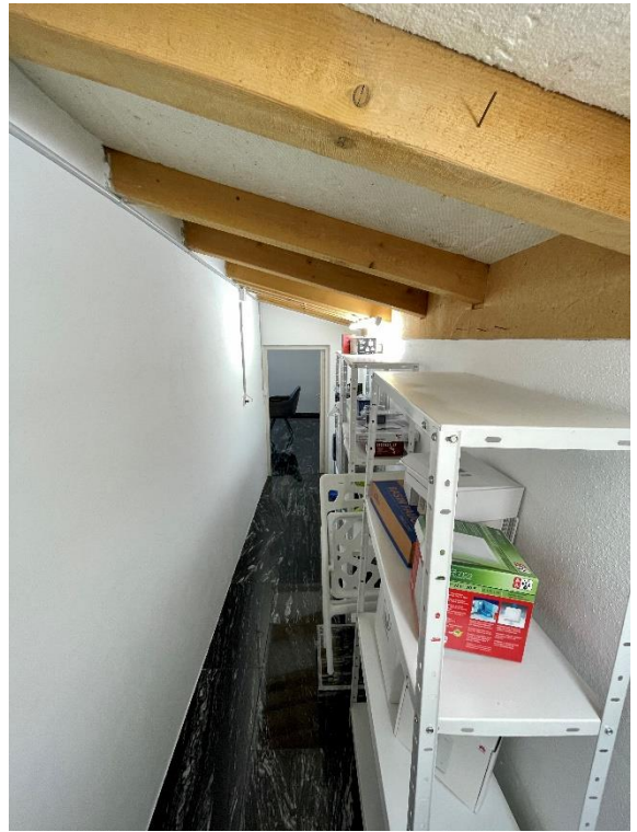
Reduit / Abstellraum