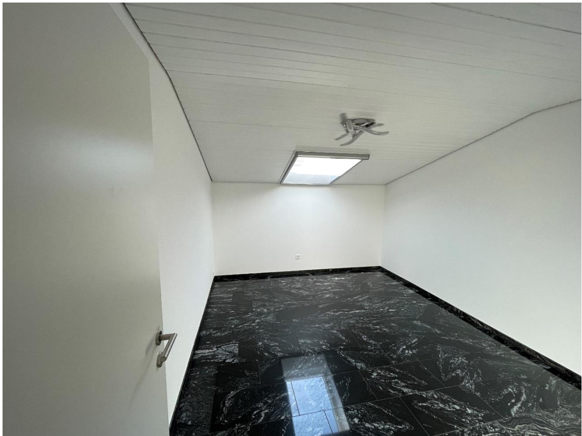
Kinderzimmer mit elektrischem Dachfenster