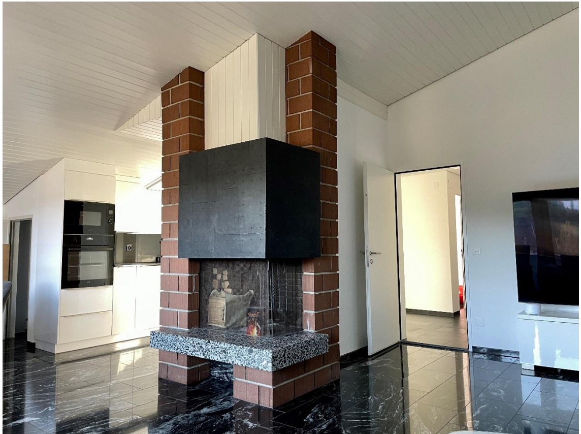
Wohnzimmer mit Cheminée