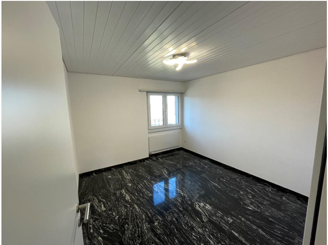
Kinderzimmer mit Fassadenfenster