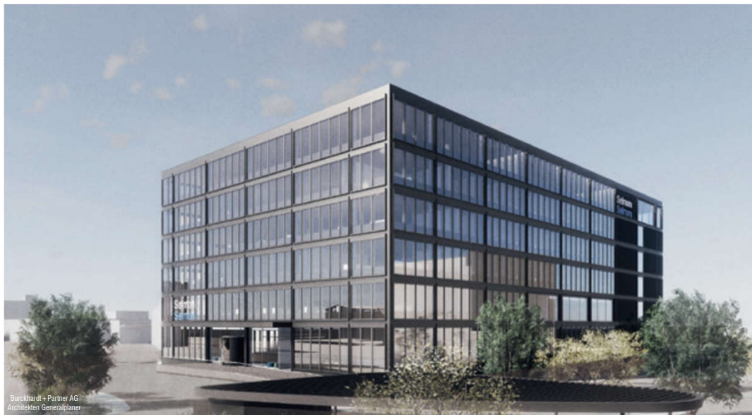
Burchardt + Partner AG Architekten Generalplaner