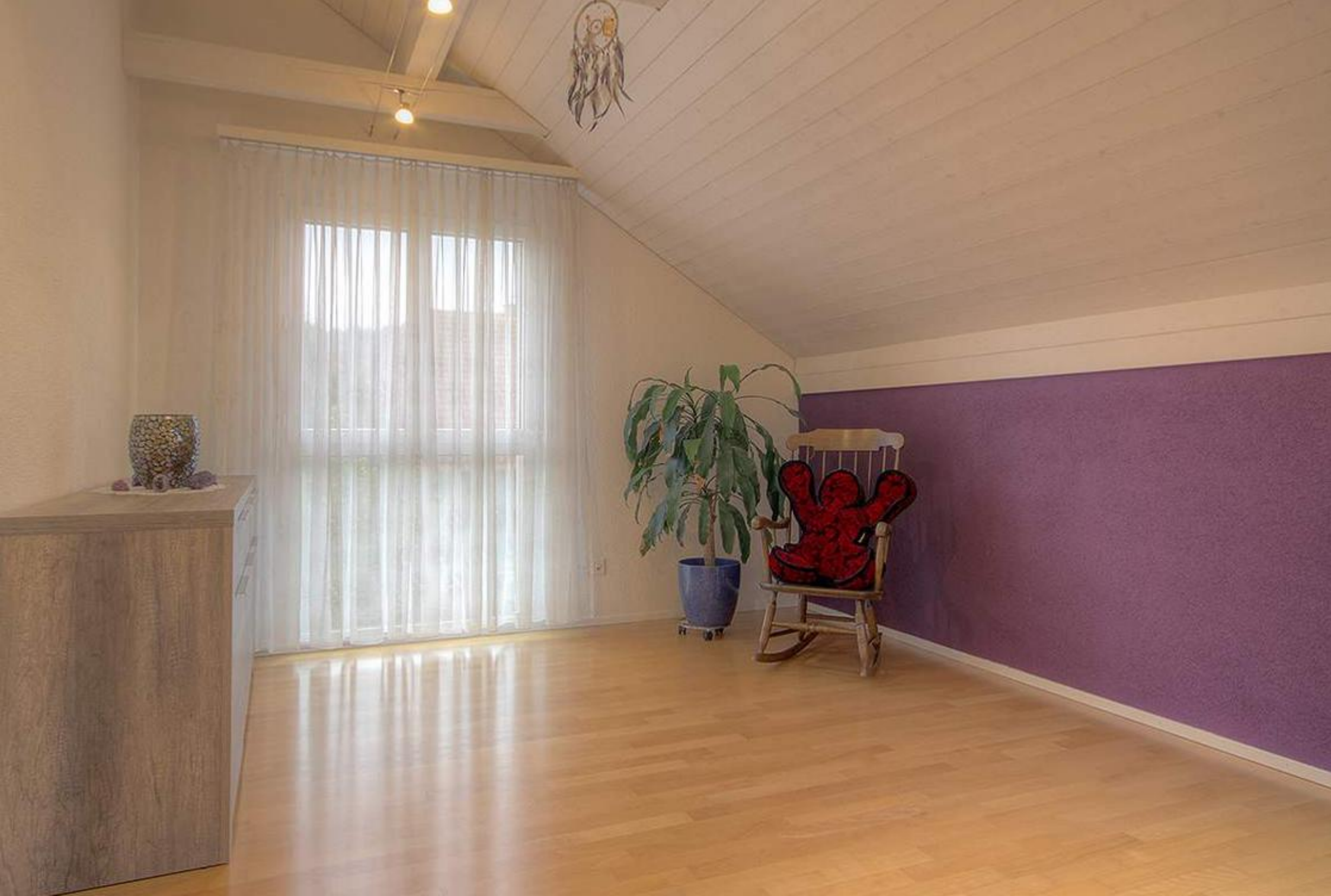
Zimmer 1 & 2 Anstrich 2024 in Farbe abricot gestrichen