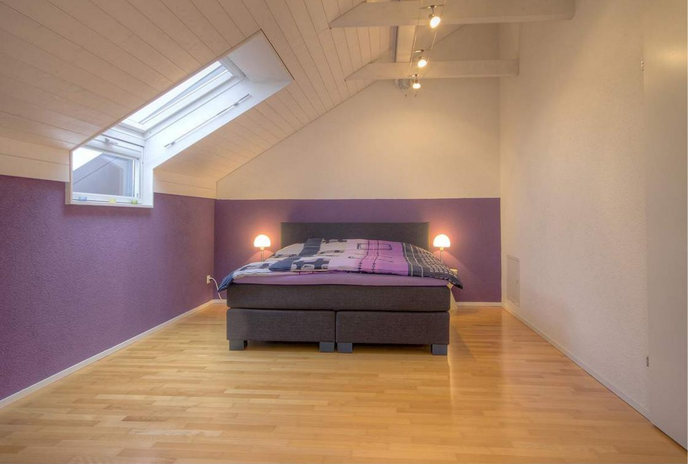
Zimmer 1 & 2 Anstrich 2024 in Farbe abricot gestrichen