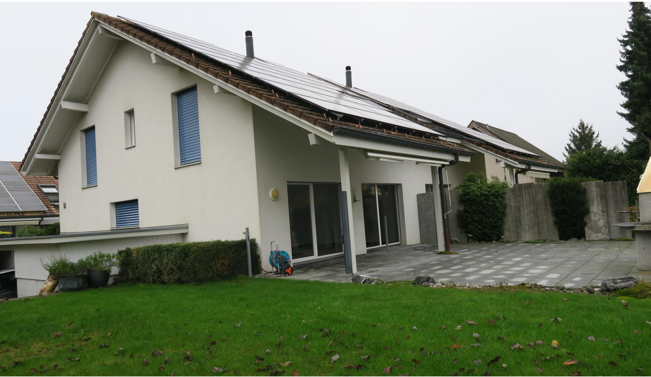
6.5 ZIMMER DOPPELEINFAMILIENHAUS MEISENWEG 7, 3252 WORBEN