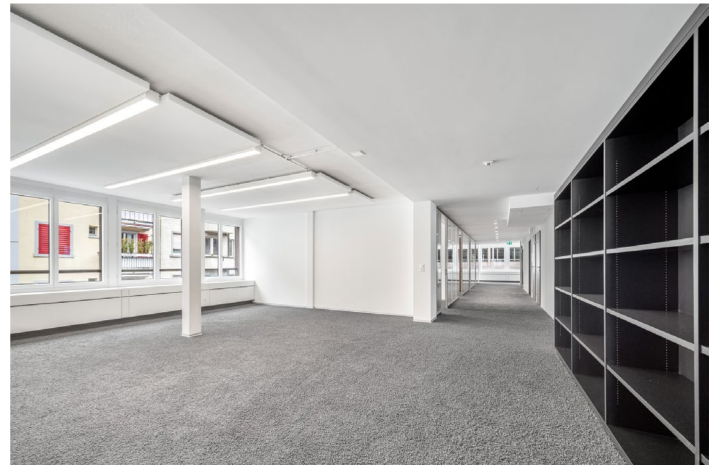
Referenzfoto einer Mietfläche im 2. Obergeschoss der Liegenschaft.