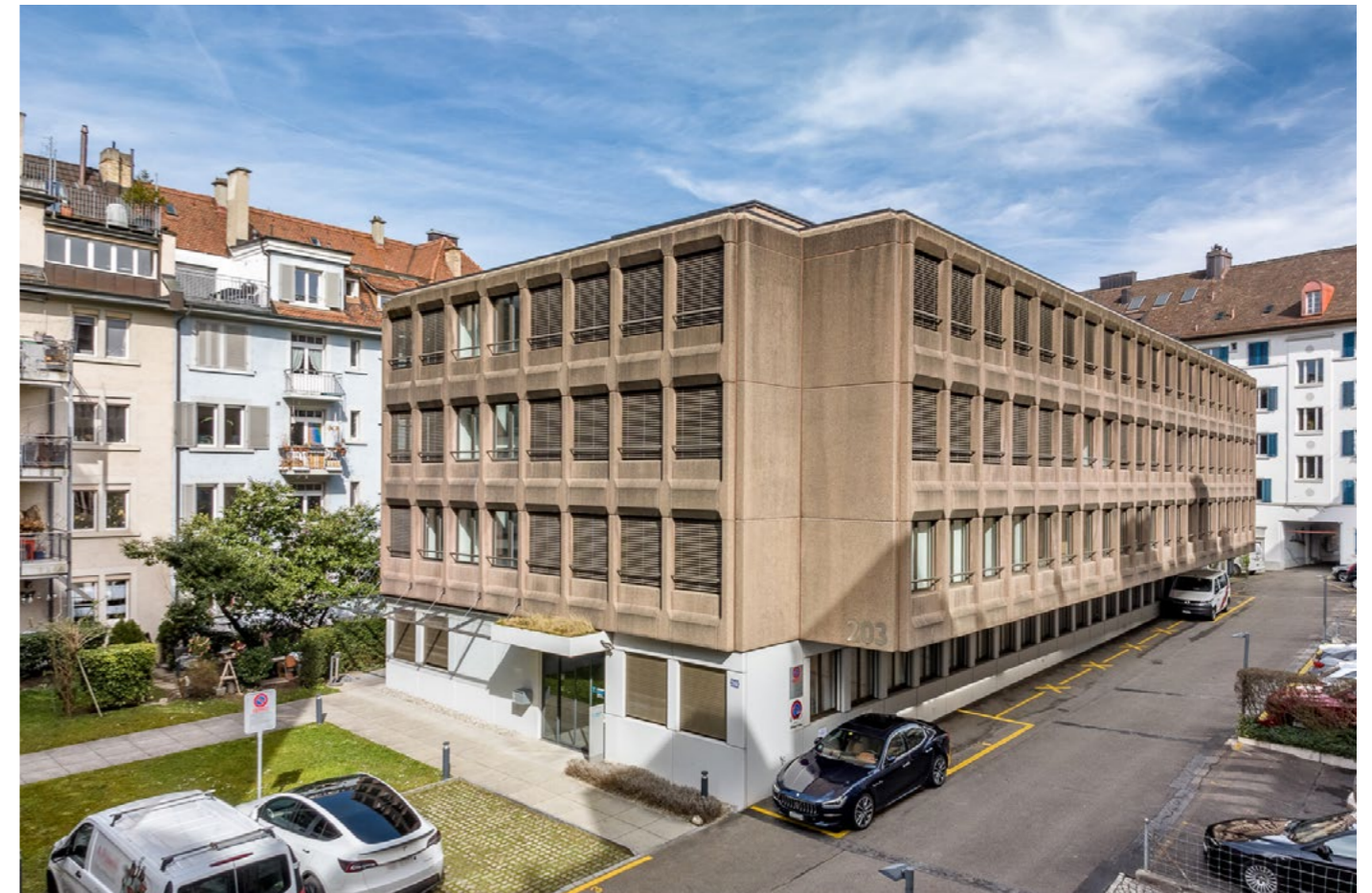
Aussenansicht Gebäude und Hauseingang.