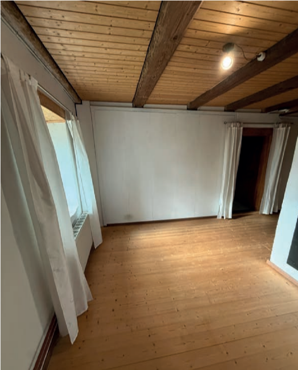
Heller Vorplatz im 1. Obergeschoss