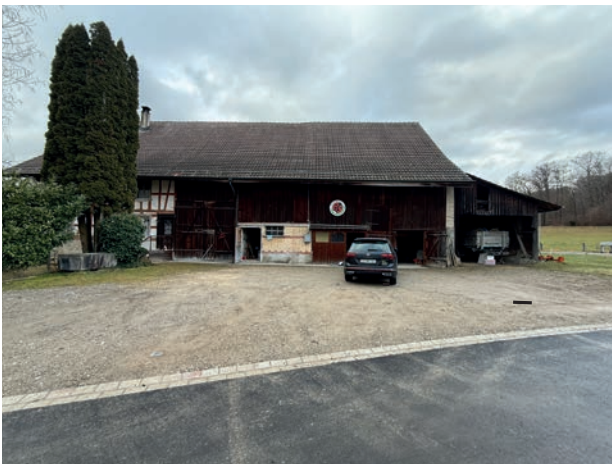
Aussenansicht Vorplatz und Stallteil