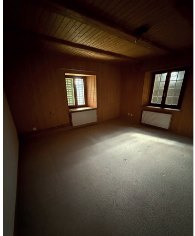
Zimmer 1. Obergeschoss