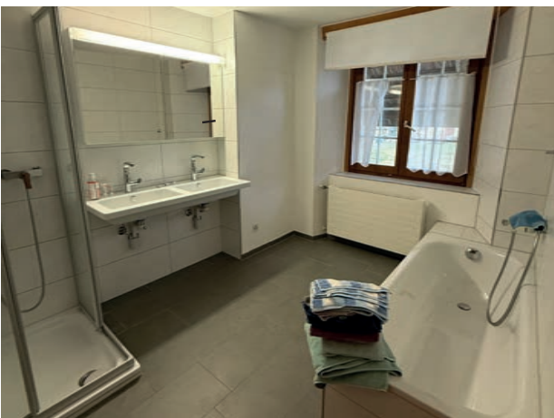
Bad / Dusche