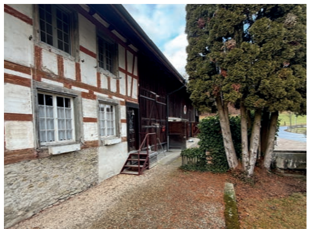
Vorplatz und Zugang zum Wohnhaus