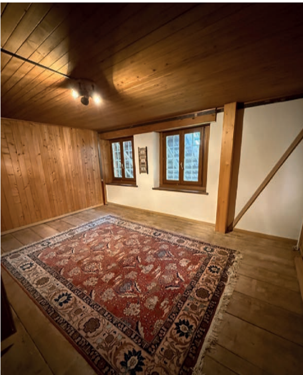
Zimmer 1. Obergeschoss