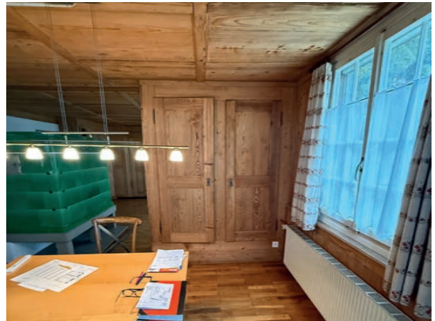
Wohn- / Esszimmer