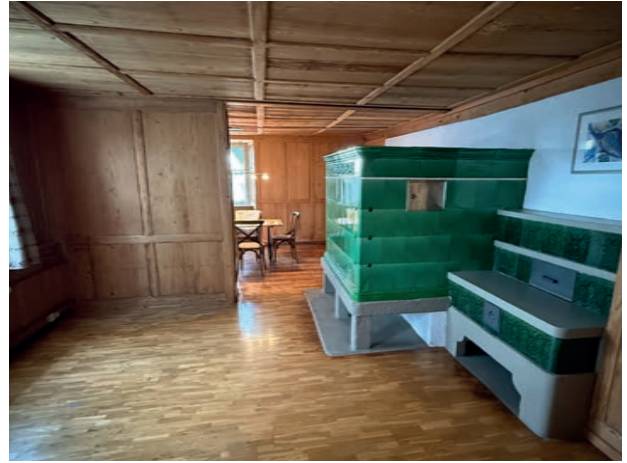
Wohnzimmer mit Kachelofen