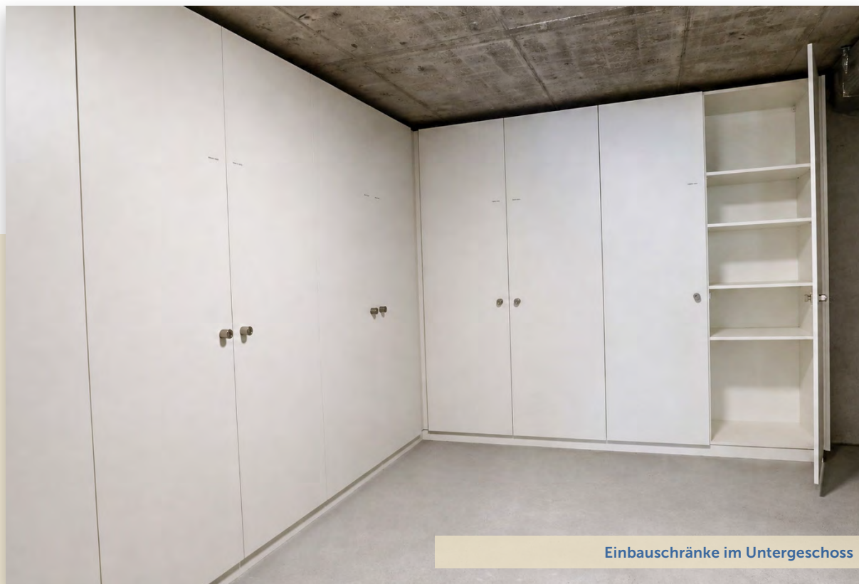
Einbauschränke im Untergeschoss