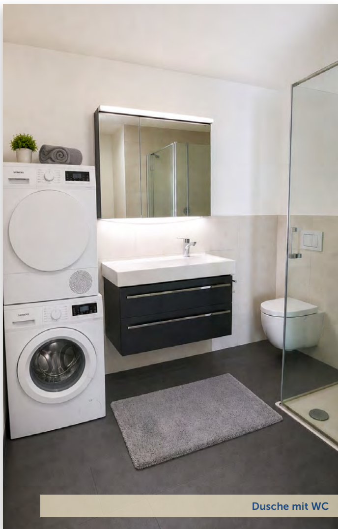
Dusche mit WC