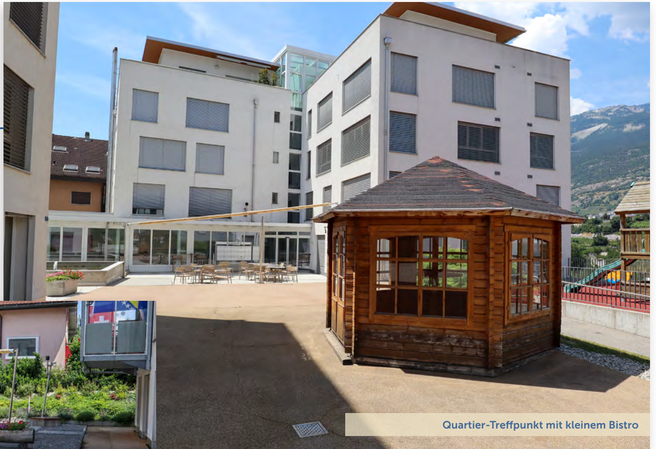
Quartier-Treffpunkt mit kleinem Bistro