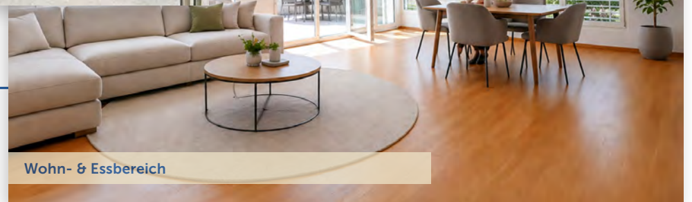
Wohn- & Essbereich