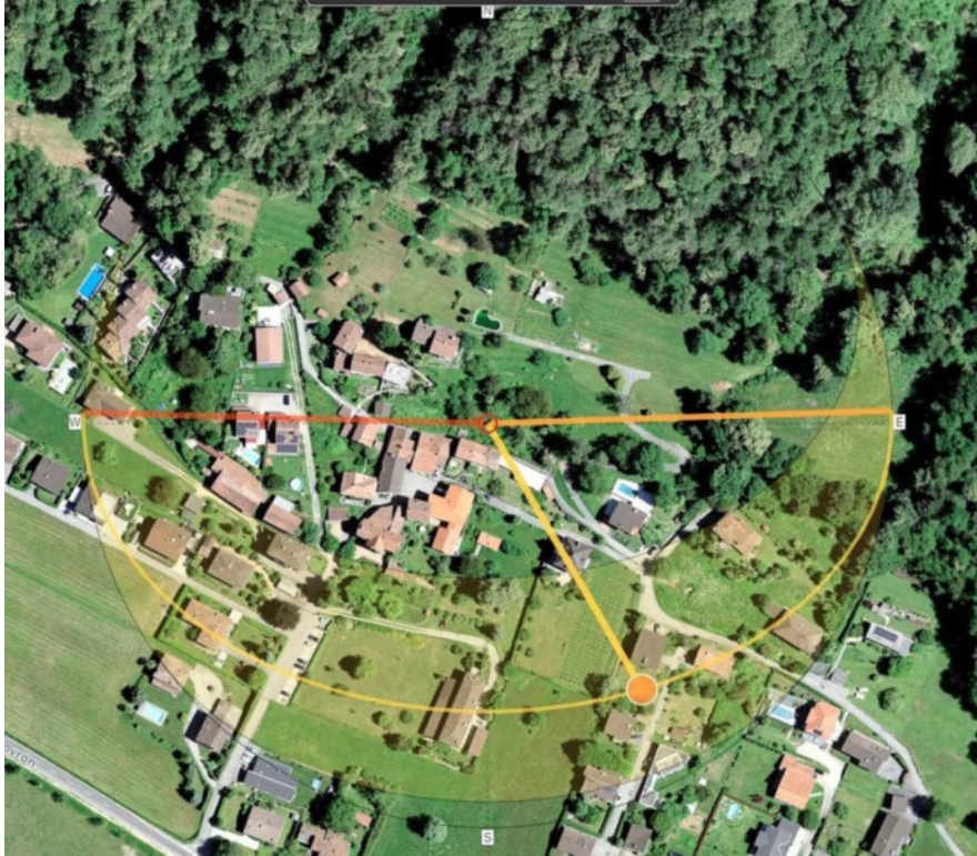
Estate / Sommer