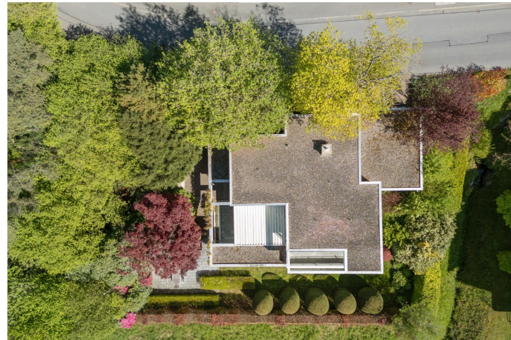
Dachaufsicht | Roof inspection