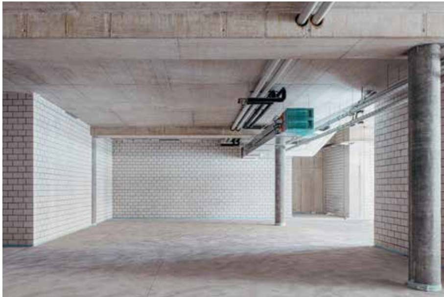
Objekt 10004 Haus Süd 1