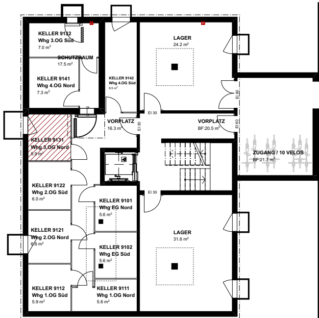
2. UG Kellerabteile