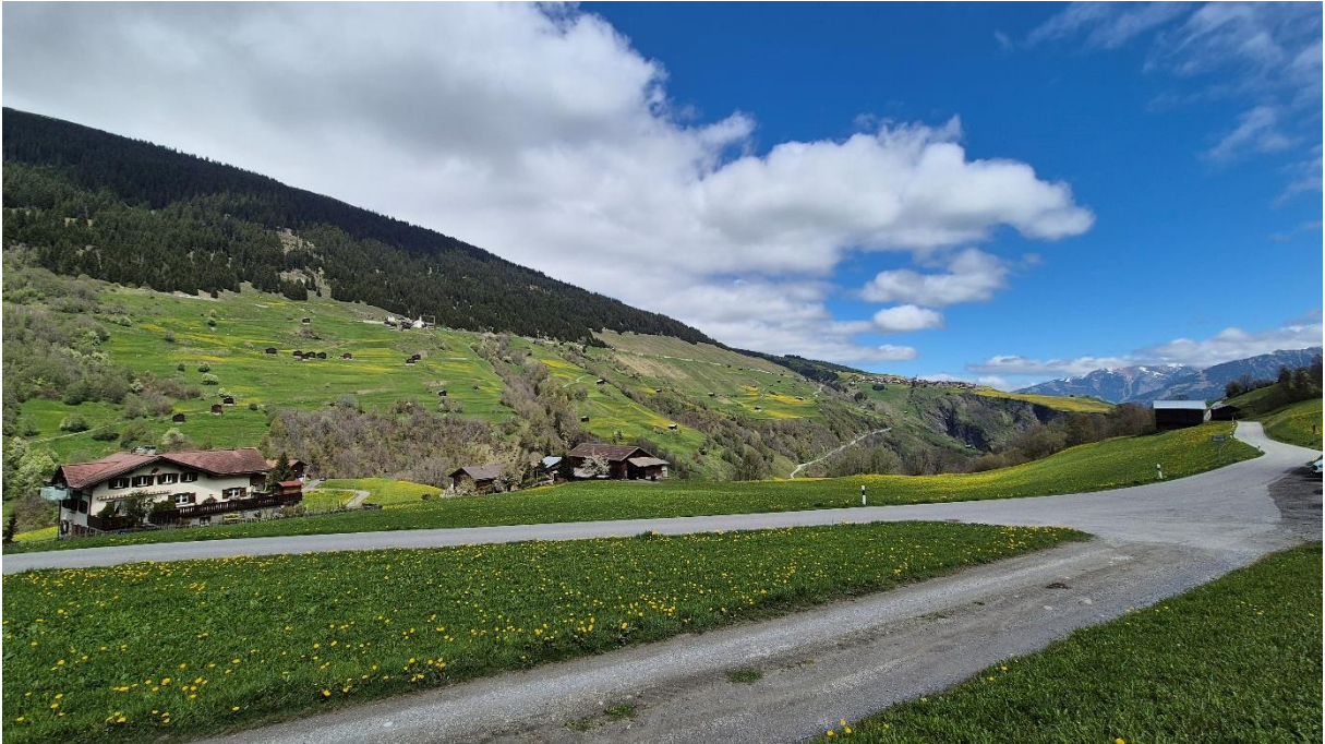
Talauswärts Richtung Lumbrein