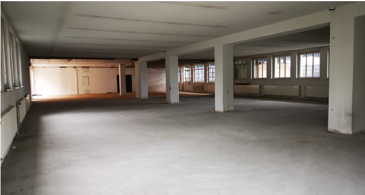
BILDERAUSWAHL - VOR UMBAU