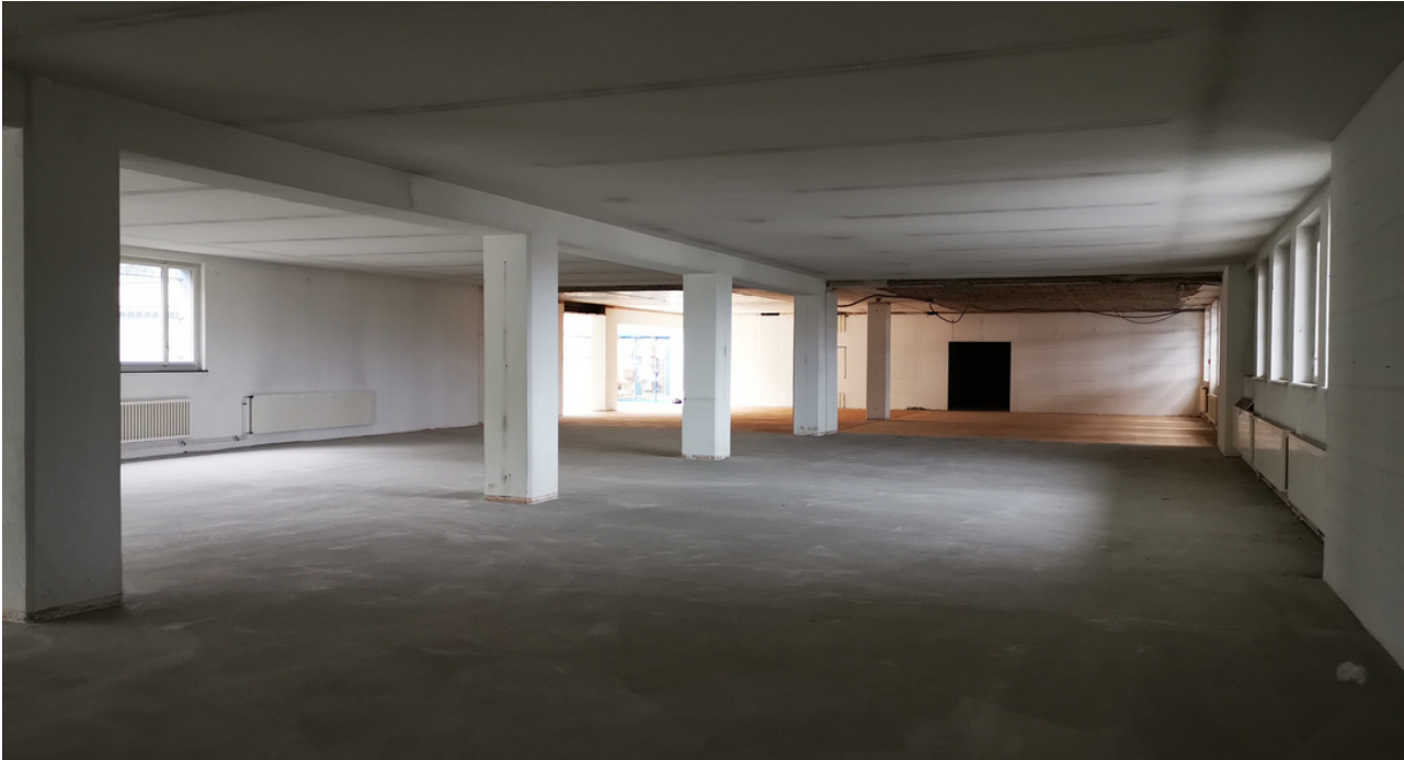
BILDERAUSWAHL - VOR UMBAU