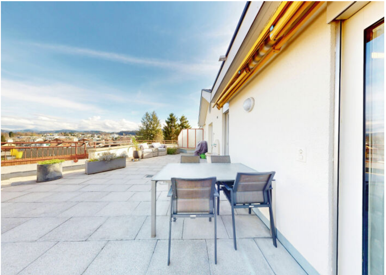
Weitläufige Terrasse mit atemberaubendem Blick auf Flawil und den Säntis.