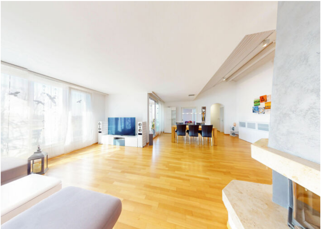
Entspannen Sie sich im grosszügigen Wohnbereich mit einem gemütlichen Cheminée.