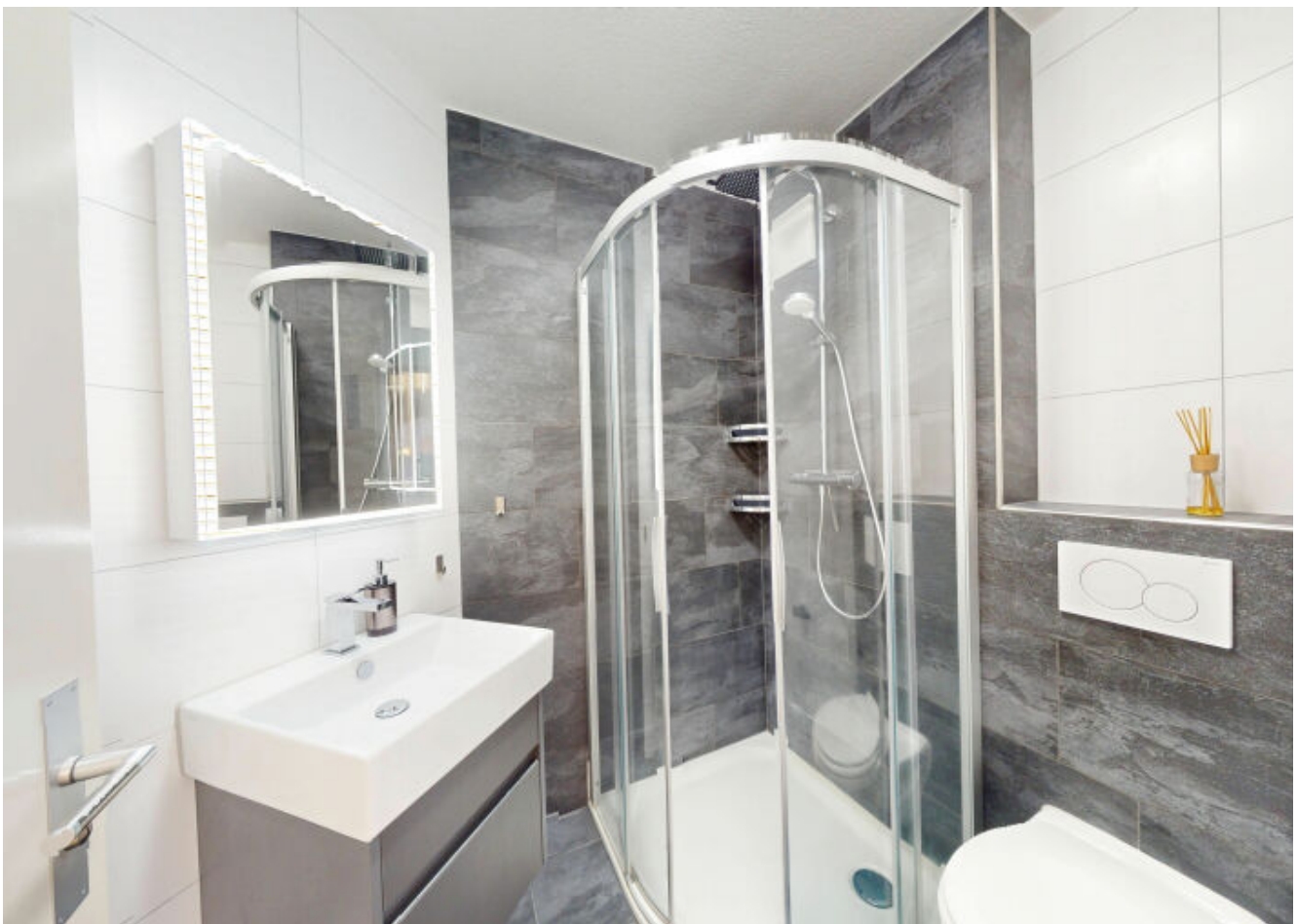
Modernes Badezimmer mit geräumiger Duschkabine - Ihr persönlicher Rückzugsort für erfrischende Momente.