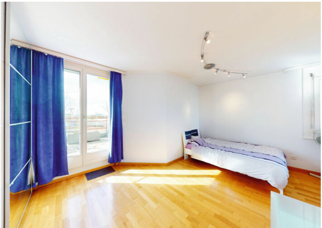
Kinderzimmer mit direktem Zugang zur Terrasse - ein spielerischer Raum für Abenteuer im Freien.