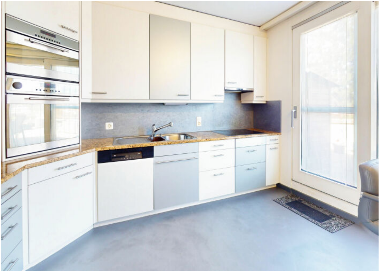
Moderne Küche mit Steamer, Backofen und Induktionsherd – Kochen leicht gemacht!