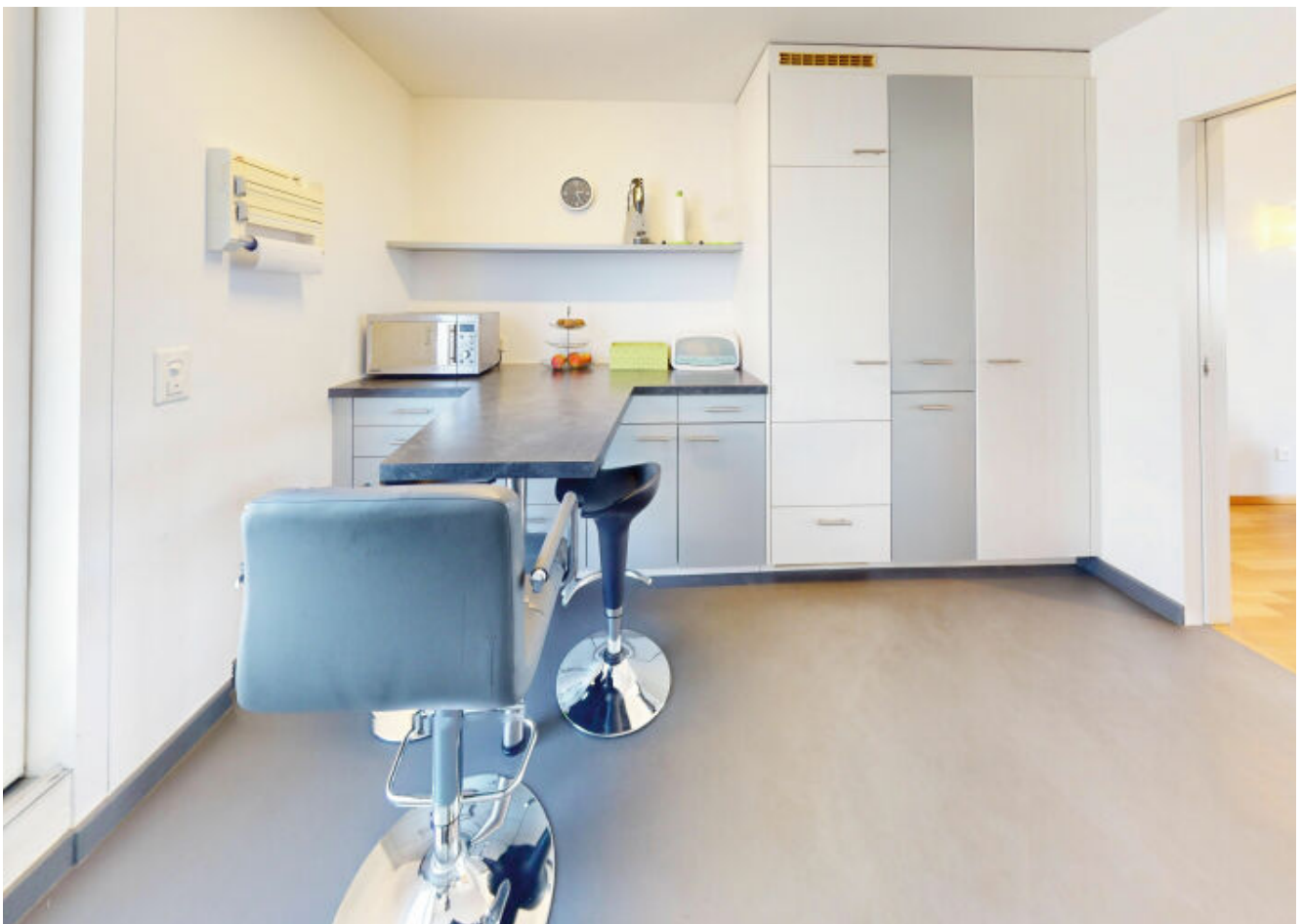
Geräumige Küche mit Frühstücksecke - der perfekte Ort, um den Tag genussvoll zu beginnen und kulinarische Köstlichkeiten zuzubereiten.