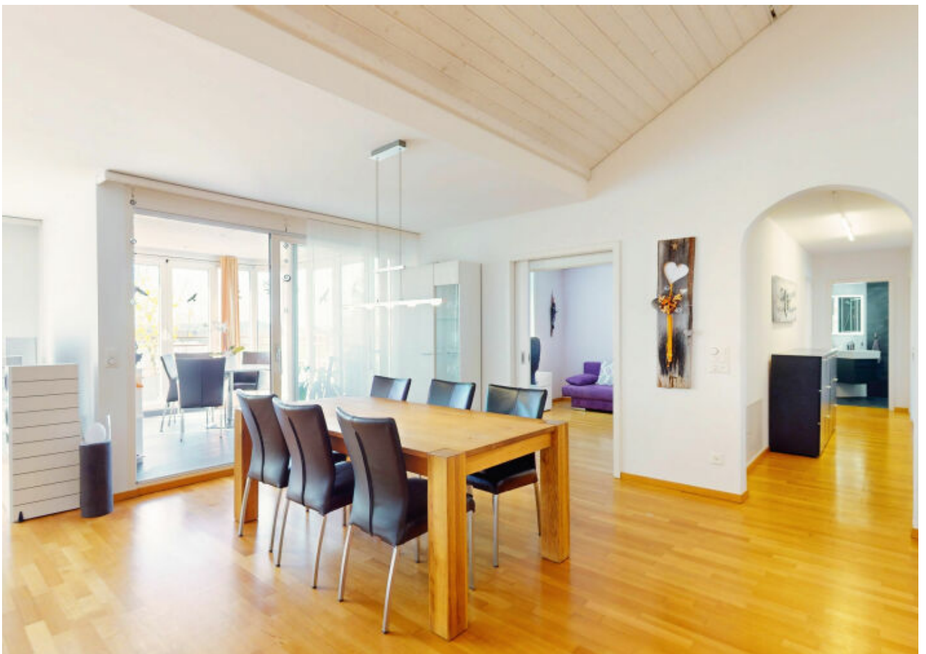
Geniessen Sie kulinarische Köstlichkeiten im einladenden Essbereich.