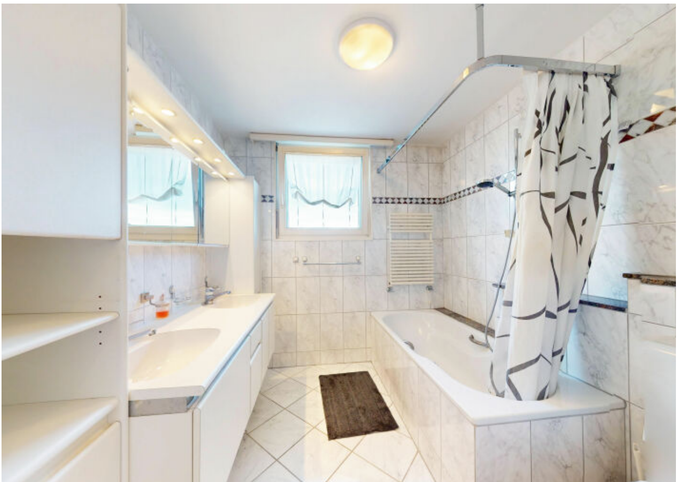
Badezimmer mit Doppelwaschbecken, Badewanne und Fenster - ein heller und geräumiger Ort für Entspannung und Erfrischung.