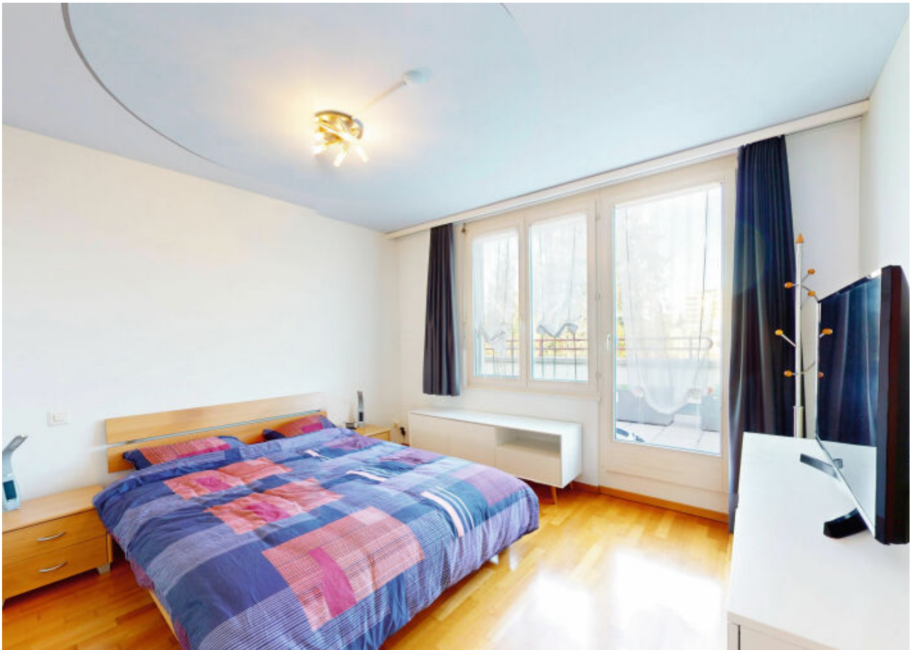
Erholsame Momente - Das Elternzimmer mit direktem Terrassenzugang