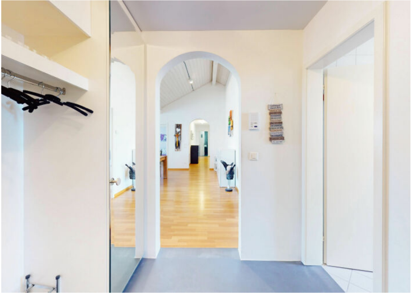
Der Eingangsbereich empfängt Sie mit einem sofortigen Wohlfühlambiente.