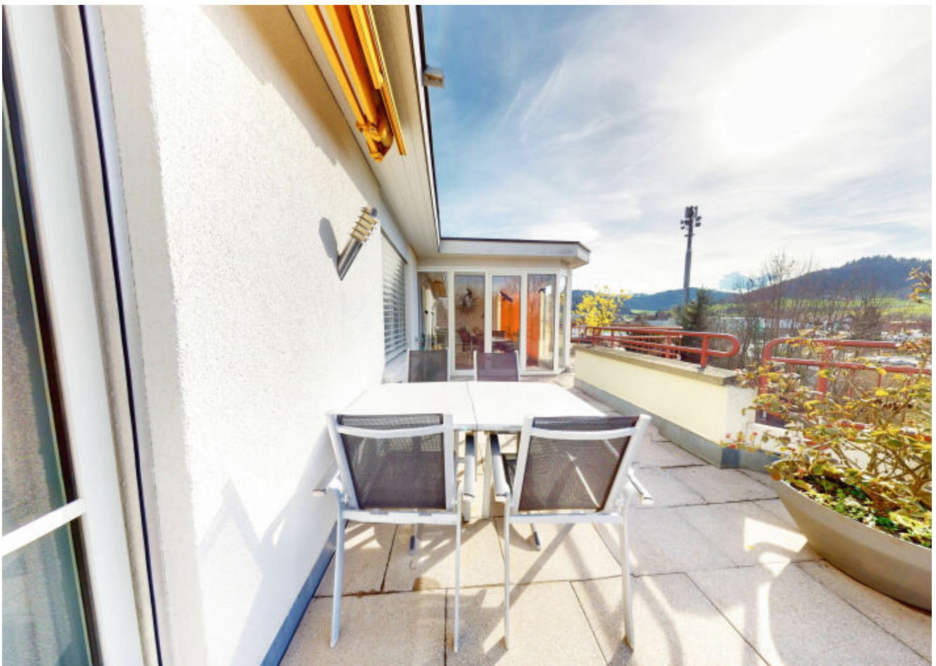
Geniessen Sie die Terrasse mit Blick auf die malerische Natur von Flawil.