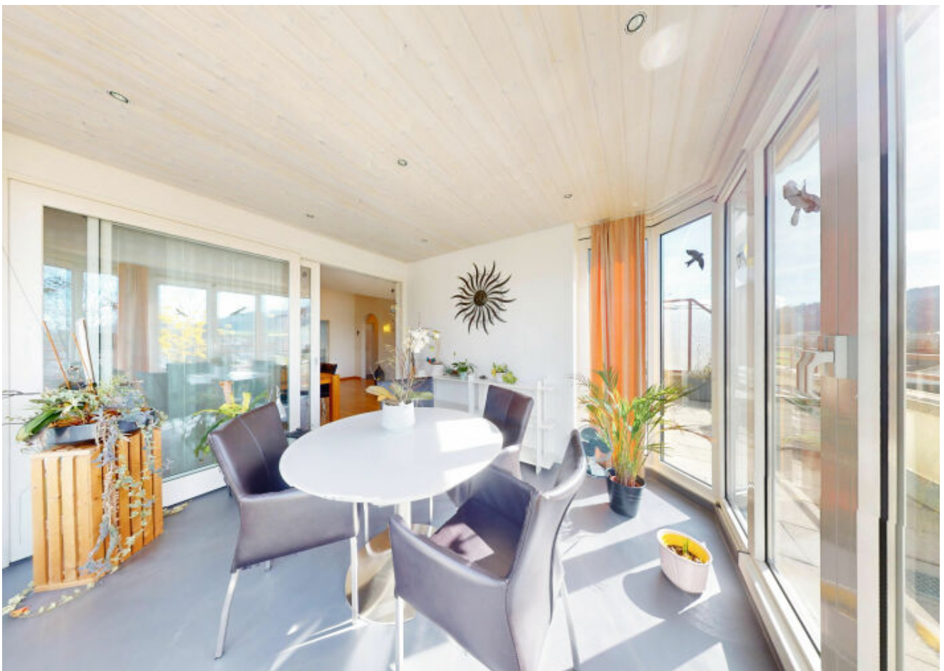
Genießen Sie das ganze Jahr über die Natur im Wintergarten oder auf dem Balkon.