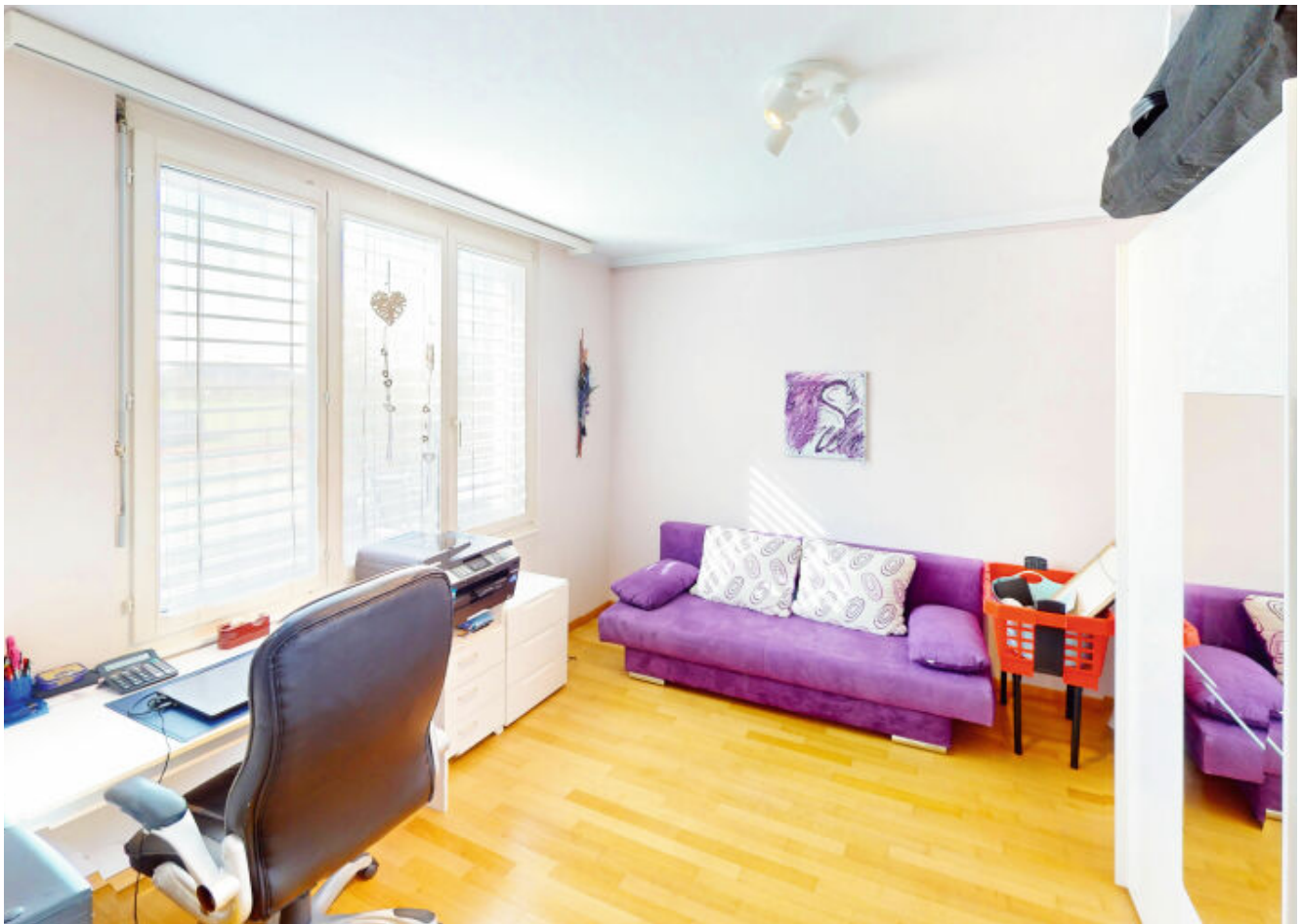
Büro - Ihr persönlicher Arbeitsplatz für Produktivität und Kreativität.