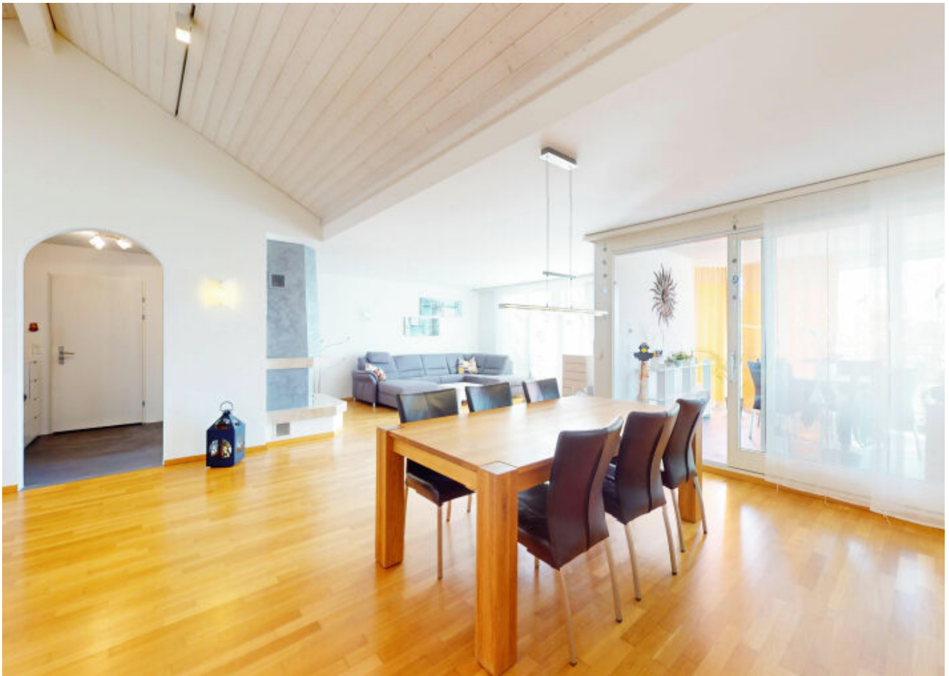
Einladender Wohnbereich mit ausreichend Platz für Gäste – perfekt zum Entspannen und Geselligsein.