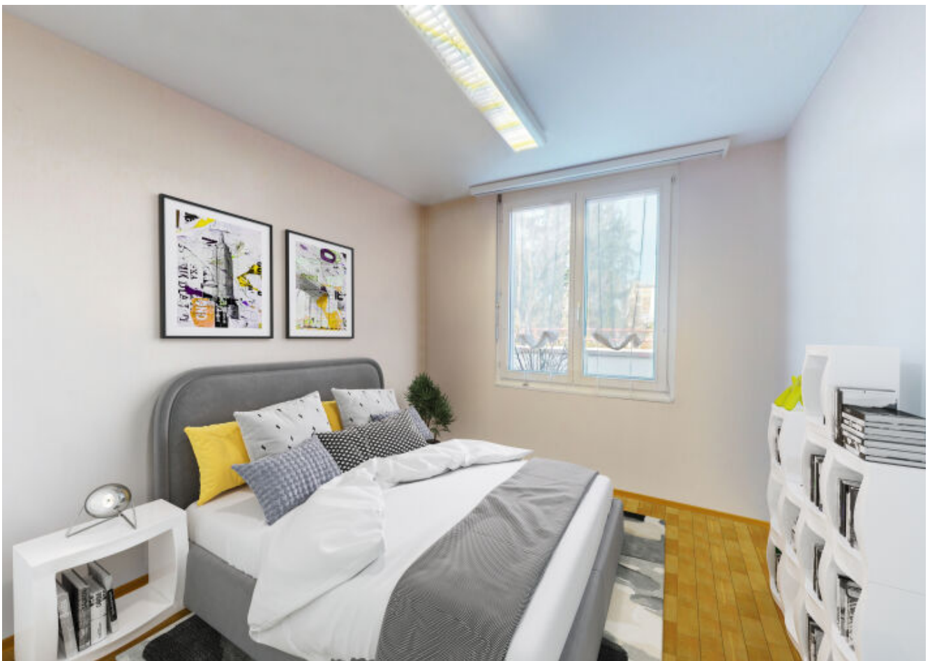
So könnte das zukünftige Kinderzimmer aussehen (digital möbliert) - ein Raum voller Fantasie und Möglichkeiten für Ihr Kind.