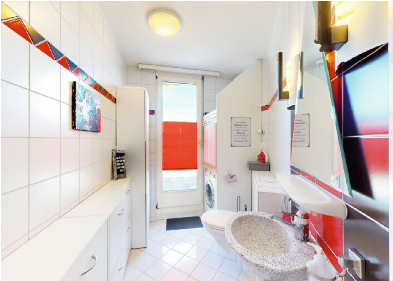
Gäste-WC mit Waschturm.