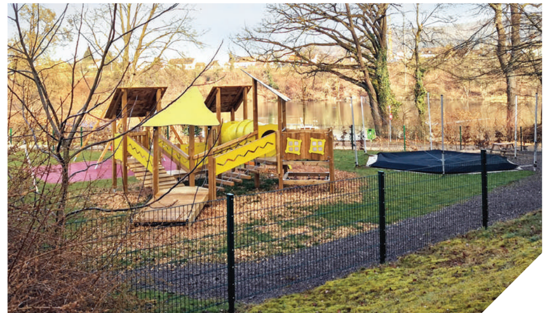
Aussensitzplatz mit Tischen und Bänken sowie Spielplatz der hausinternen Kita