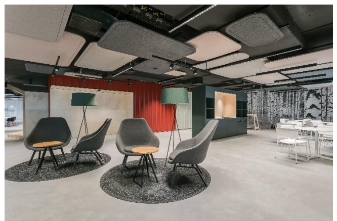
(ein Sitzungszimmer von dreien in der Lobby bzw. Lobbyausschnitt)

Video des ECOPARK TIVOLI: https://youtu.be/99dj1S054o8