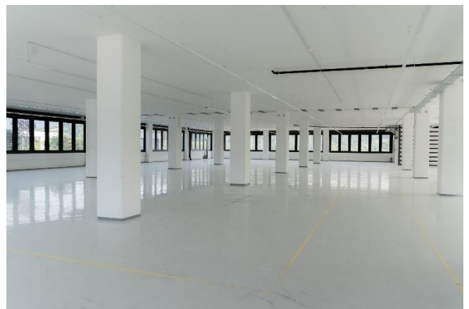
(Mietfläche 5. OG bzw. Mietfläche 3. OG noch ohne Trennwand)