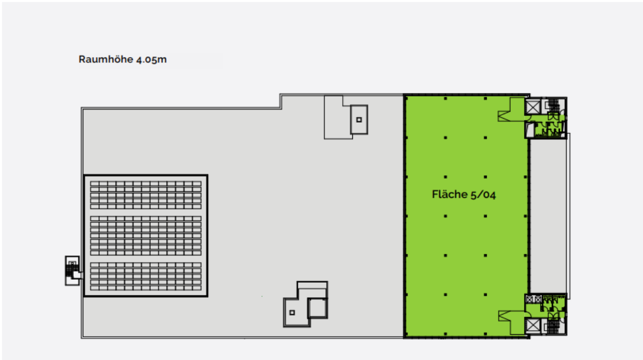
(Grundriss 5. OG mit 1'235m 2 – grün gekennzeichnete Fläche)