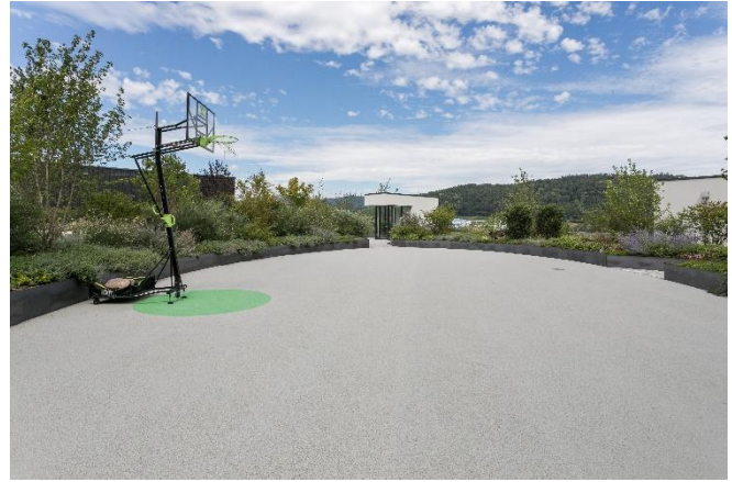
(Grillplatz Dachgarten bzw. Basketballplatz Dachgarten)