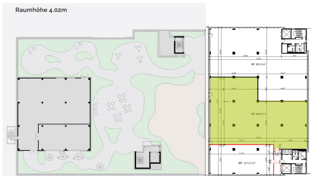
(Grundriss 3. OG mit 609m 2 – grün gekennzeichnete Fläche)