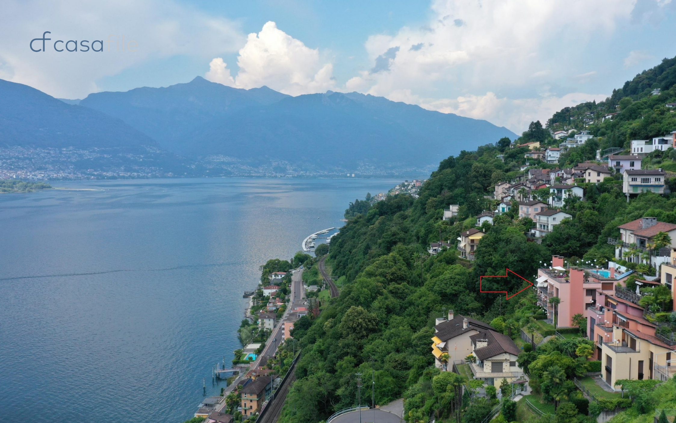
2-Zimmer-Eigentumswohnung mit herrlicher Sicht auf den Lago Maggiore Via Serafino Balestra 37, 6576 Gerra Gambarogno