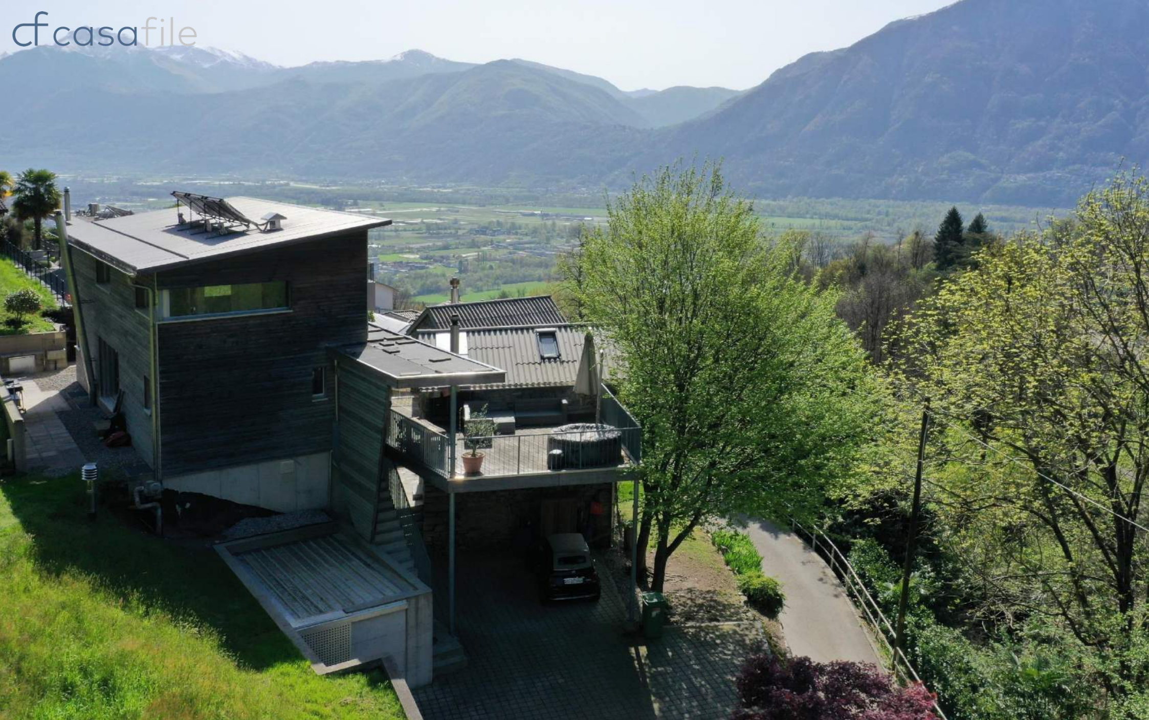
Liegenschaft aus Einfamilienhaus in ökologischer Bauweise und 2 Tessiner Rustici Via alla Costa 20, 6645 Tenero-Contra