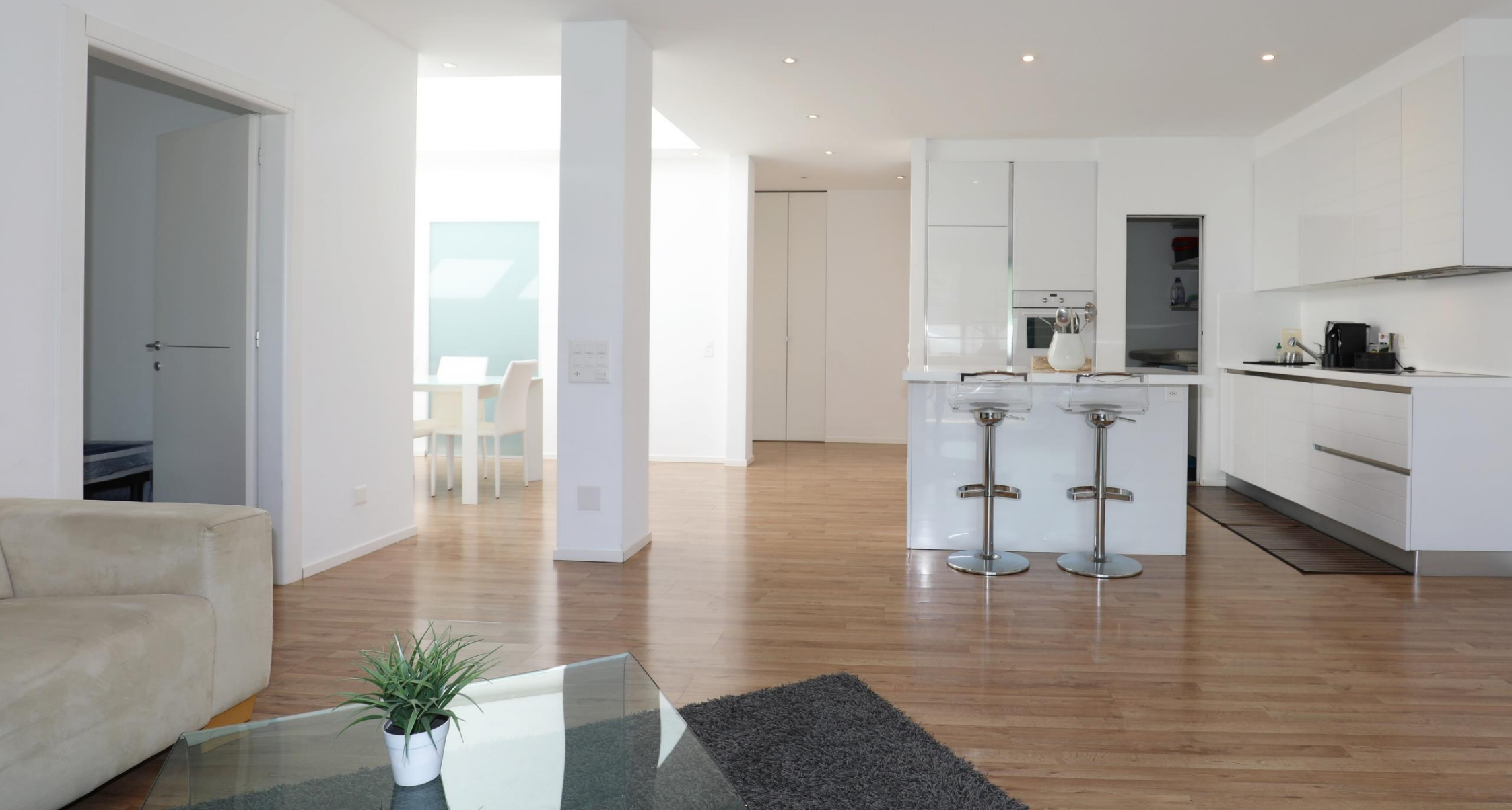
3.5-Zimmer-Attika-Eigentumswohnung zentral gelegen Via Preda 1a, 6541 Sementina