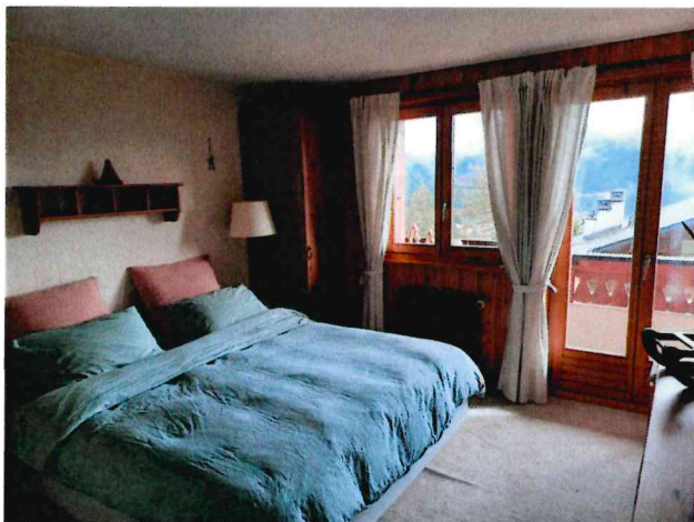
Chambre lit matrimonial