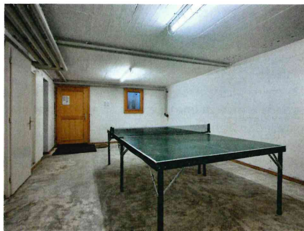
Salle de jeux commune