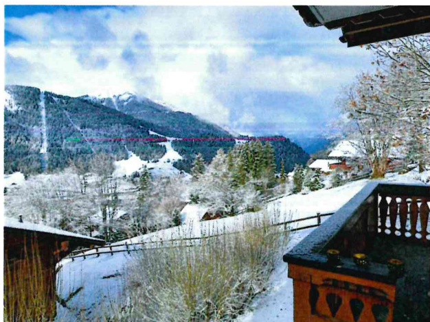
Vue sur les meillerets