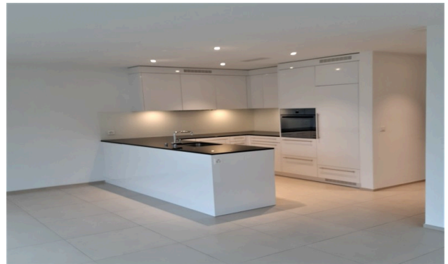
Cuisine d'un autre appartement du bâtiment pour illustration