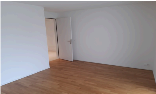
Chambre d'un autre appartement du bâtiment pour illustration