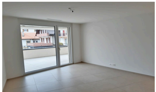
Séjour d'un autre appartement du bâtiment pour illustration