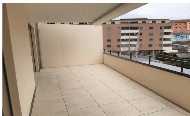
Terrasse d'un autre appartement du bâtiment pour illustration