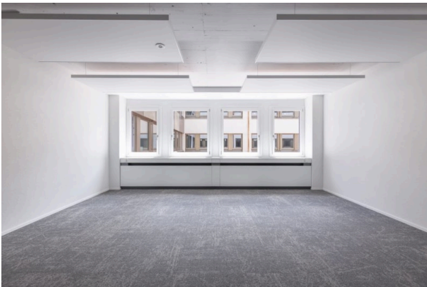
Musterbeispiel Office (35 m 2 ) - Ihre leere Leinwand für neue Ideen