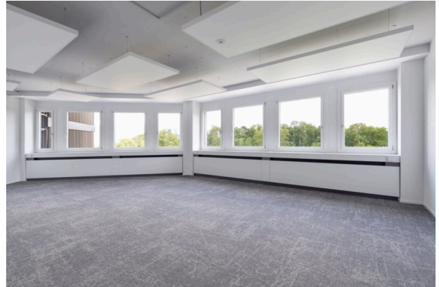
Musterbeispiel Office (81 m 2 ) – unmöbliert, bereit für Ihre Vision