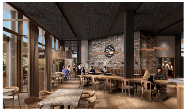
Restaurant im Erdgeschoss - stilvolles Ambiente drinnen, charmante Terrasse draussen