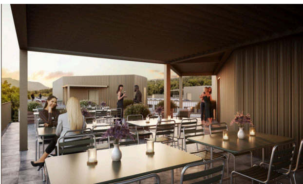
Moments après le travail - l'apéritif parfait au-dessus des toits de la ville