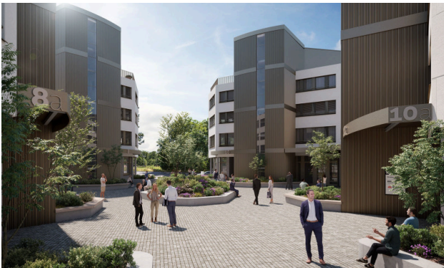
Cour intérieure végétalisée - un havre de calme et de bien-être