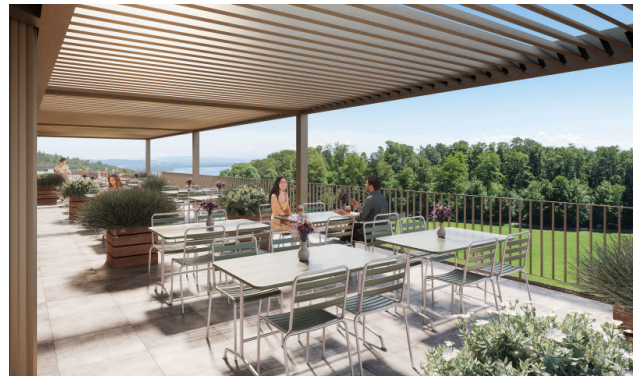
Vue sur le lac et bain de soleil - la terrasse parfaite pour savourer un déjeuner paisible