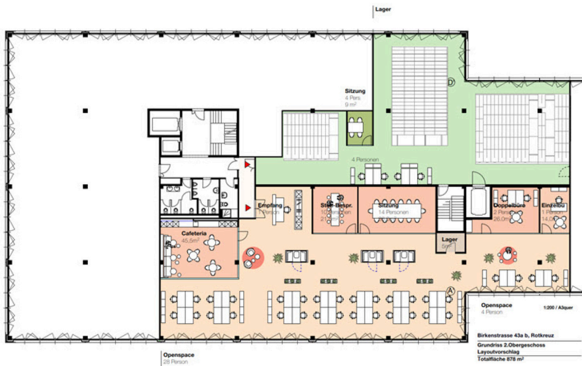
Grundrissplan 2. Obergeschoss Birkenstrasse 43a/b, 6343 Rotkreuz