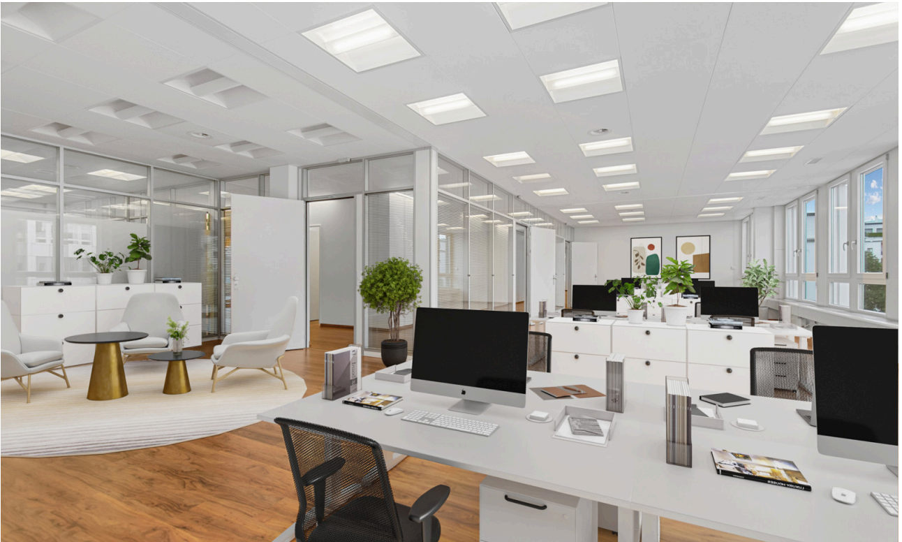
Grossraumbüro - virtuell möbliert