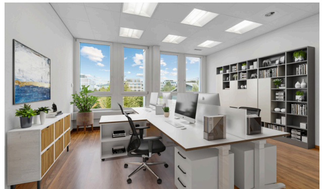
Büro - virtuell möbliert