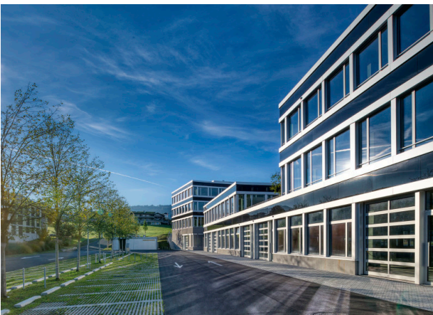
Hochwertige Glas-, Metallfassade