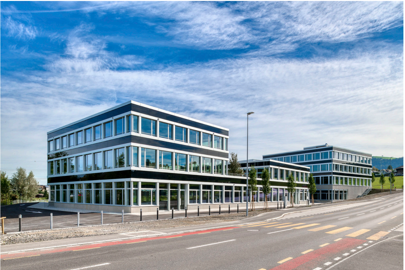
Kreuzung Dorf-, Hauptstrasse in Richtung Dorfzentrum Buchrain