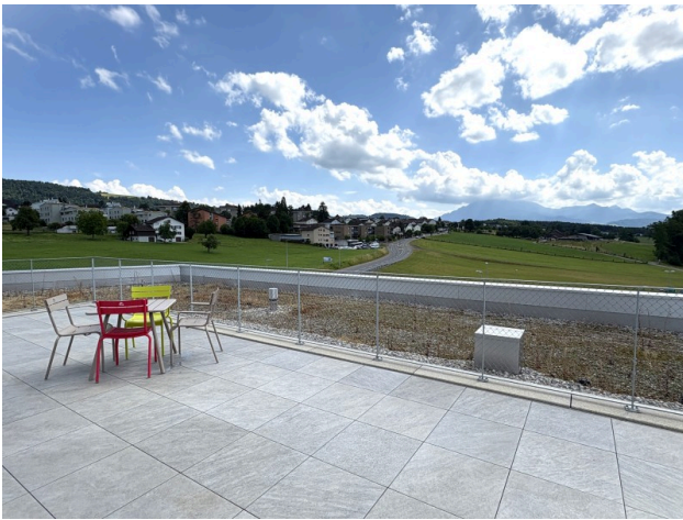
Dachterasse zur Mitbenützung mit besten Aussichten