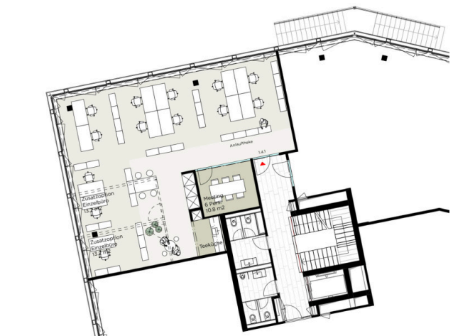
Layout- Ausführungsplan 1.4.1