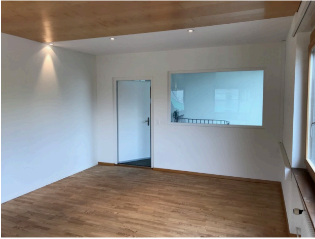
Büro / Sitzungszimmer