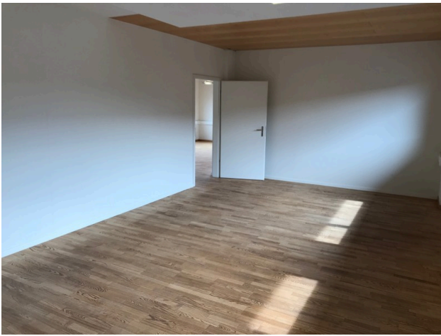
Büro / Sitzungszimmer