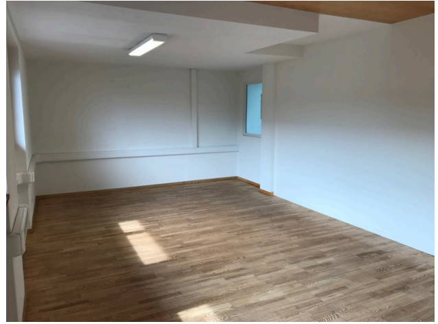
Büro / Sitzungszimmer