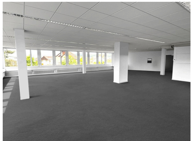
Bürobereich Richtung Eingang