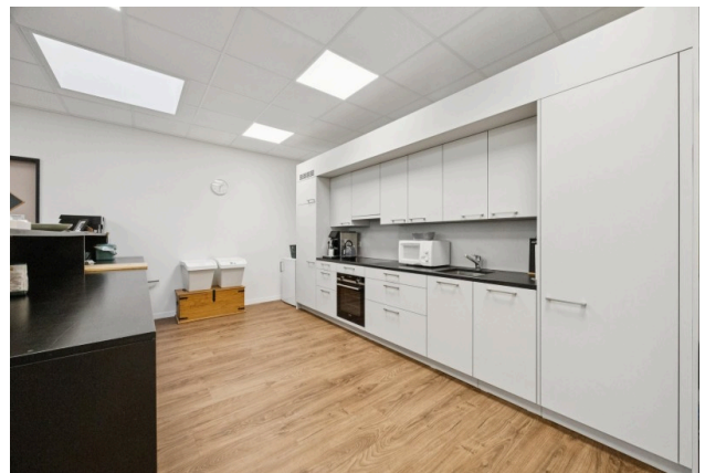
Empfangs-/ Aufenthaltszone und Küche