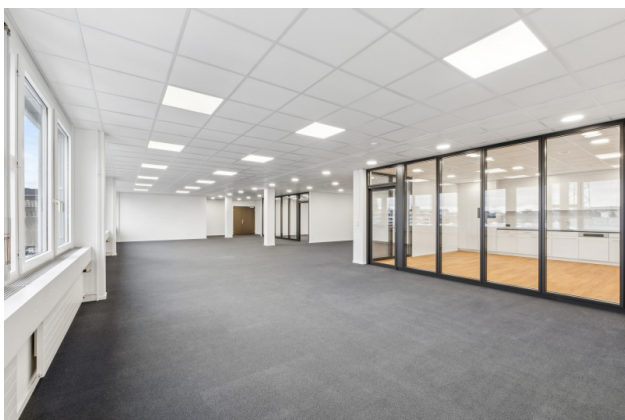
Büro Openspace / Küche