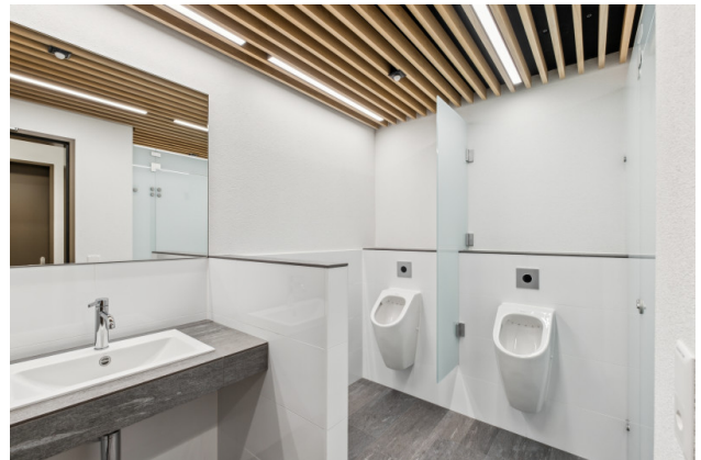
Moderne Toiletten (M/F) auf der Etage