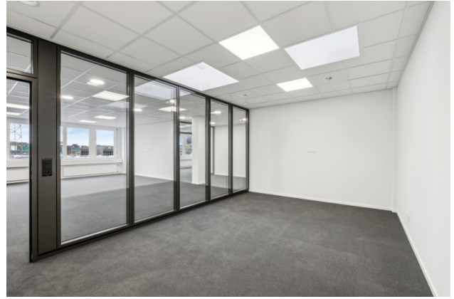
Sitzungszimmer mit Dachluke