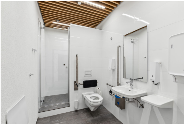
Sportlerdusche zur Mitbenutzung