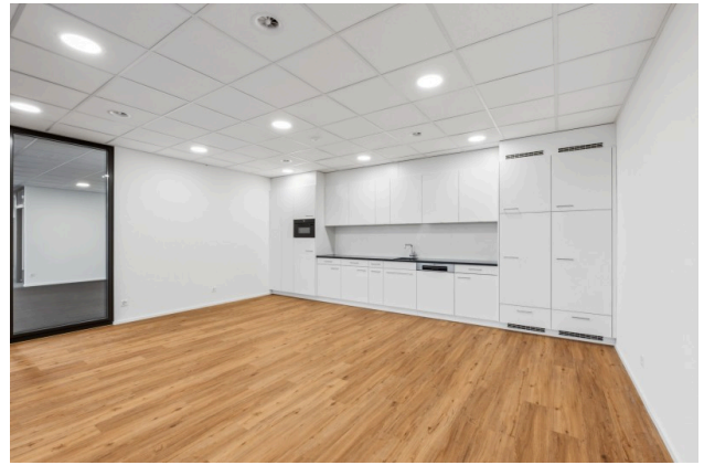
Küche / Aufenthaltsraum