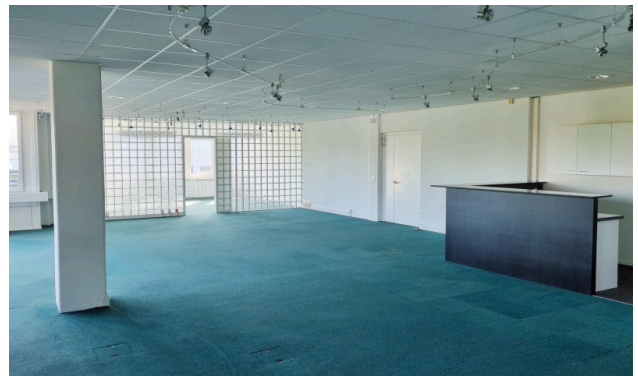
Eingangsbereich und Grossraumbüro