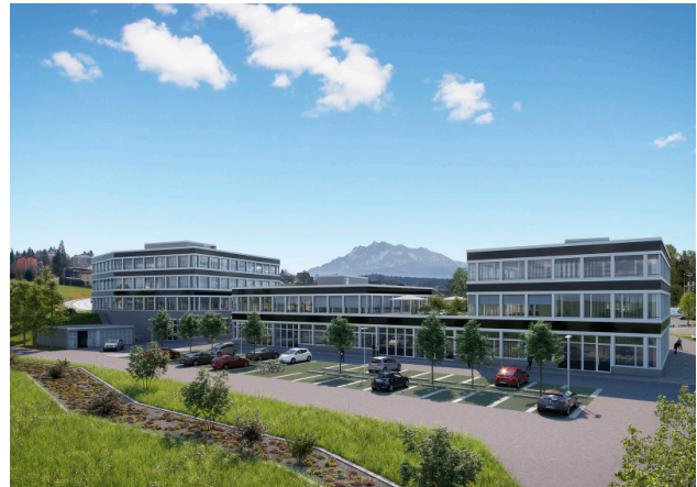
Rückseite der Gebäude 1, 3, 5 (von links)