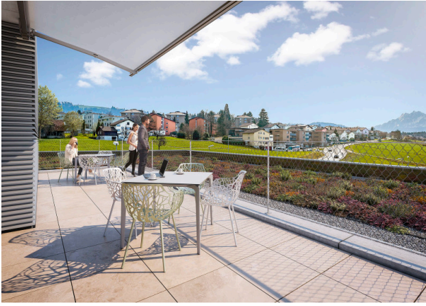
Dachterasse mit besten Aussichten zur Mitbenützung (Gebäude 1)