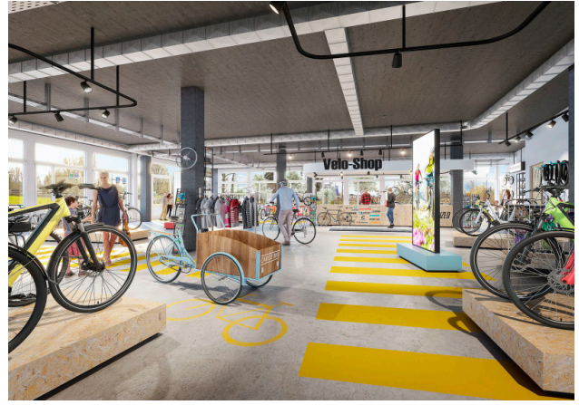
Ruhiges Gewerbe, Ausstellung, Labor, Praxis? Individueller Käuferausbau machts möglich!