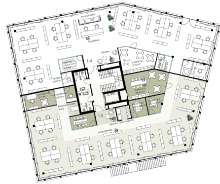
Layoutvorschlag 1. OG