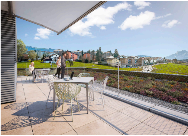
Dachterasse mit besten Aussichten zur Mitbenützung (Gebäude 1)