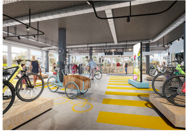
Ruhiges Gewerbe, Ausstellung, Labor, Praxis? Individueller Käuferausbau machts möglich!