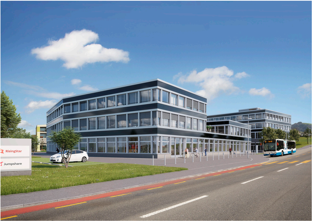
Kreuzung Dorf-, Hauptstrasse in Richtung Dorfzentrum Buchrain