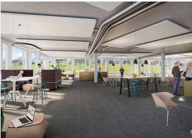
Bald Ihr eigenes Büro im 1. OG (Gebäude 1)?