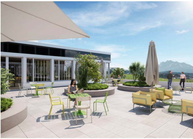
Exklusive, begrünte Terrasse 1. Obergeschoss (Gebäude 3/5)