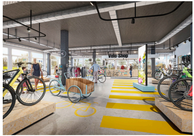
Ruhiges Gewerbe, Ausstellung, Labor, Praxis? Individueller Käuferausbau machts möglich!