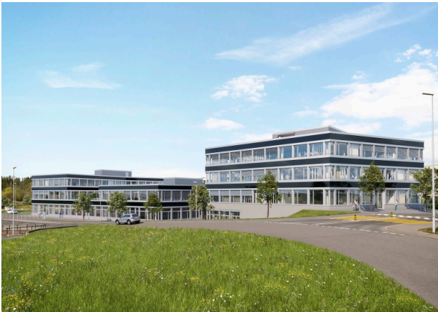
Vom Dorfzentrum Buchrain kommend mit Einfahrt Stegmattstrasse