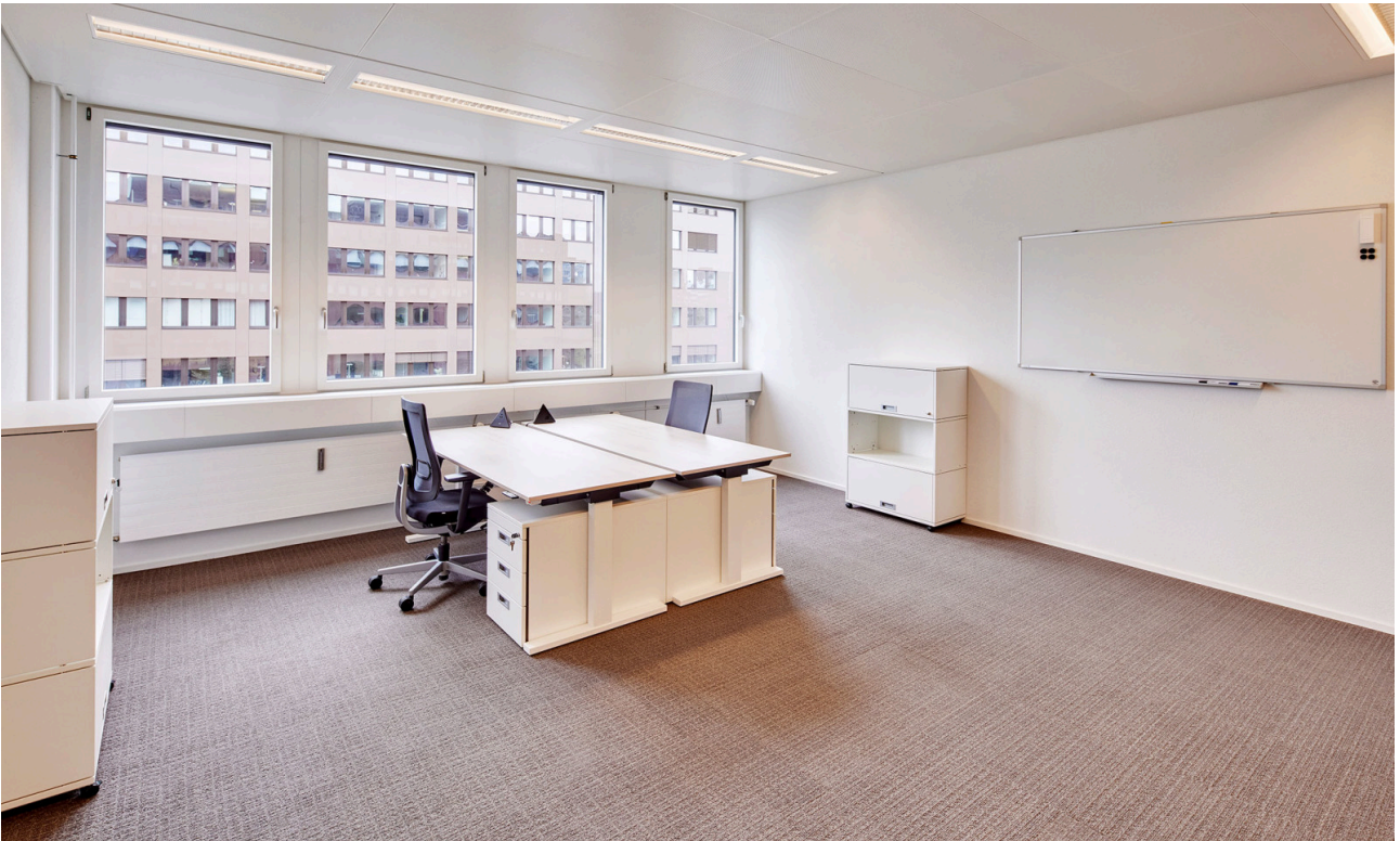
Teamoffice mit 2 bis 4 Arbeitsplätzen