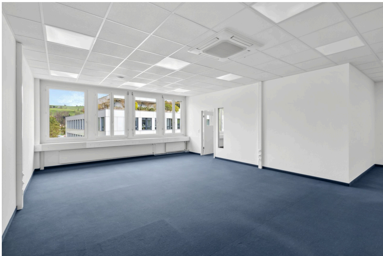
Ansicht Richtung Ost