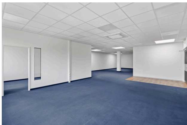
Ansicht Richtung West