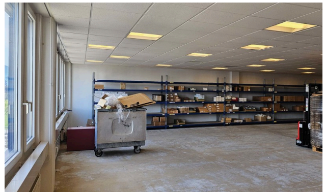
Lagerfläche im 2. Obergeschoss