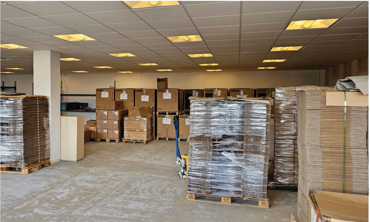
Lagerfläche im 2. Obergeschoss