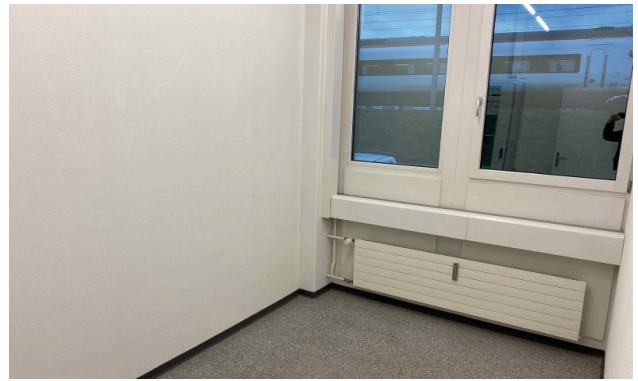
Server/Archiv mit Tageslicht