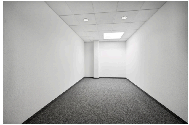
Archiv / Lager