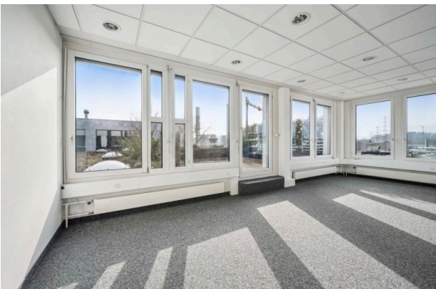
Empfangsbereich / Zugang Terrasse