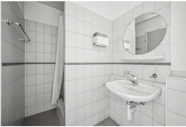
Dusche / Toilette