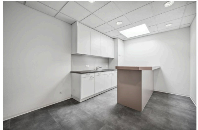
Küche / Aufenthaltsbereich