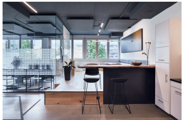
Podest mit Aufenthaltsbereich / Team-Area