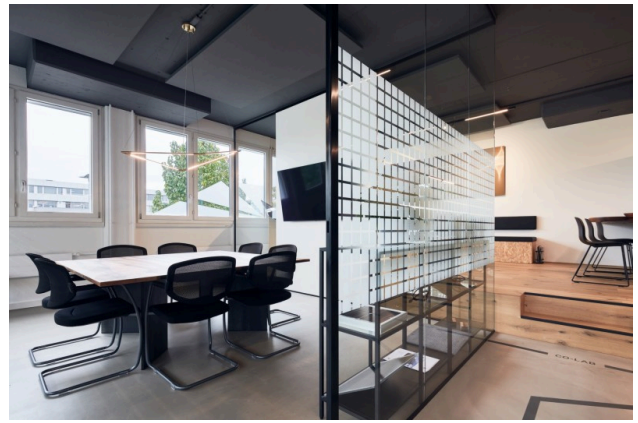
Blick ins Sitzungszimmer