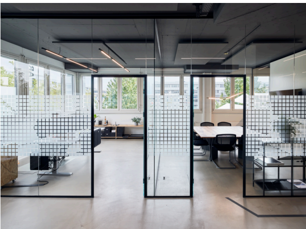
Sitzungszimmer und Büroraum verglast