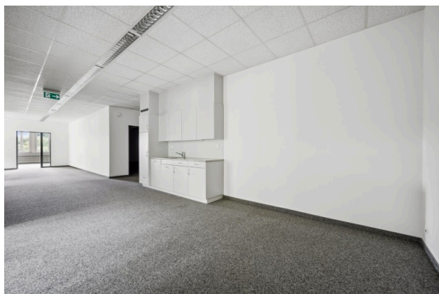
Küche / Aufenthalt