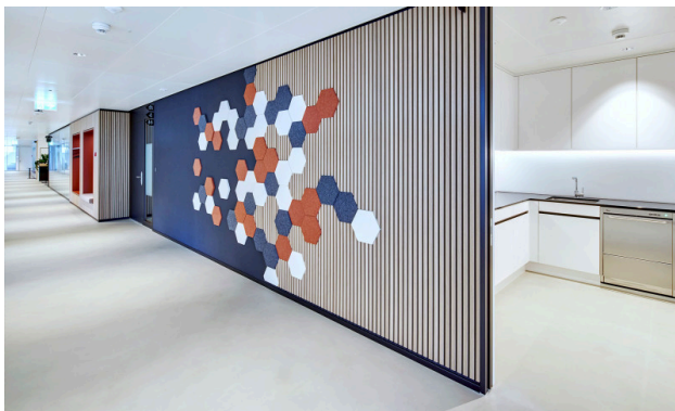
Korridor / Küche