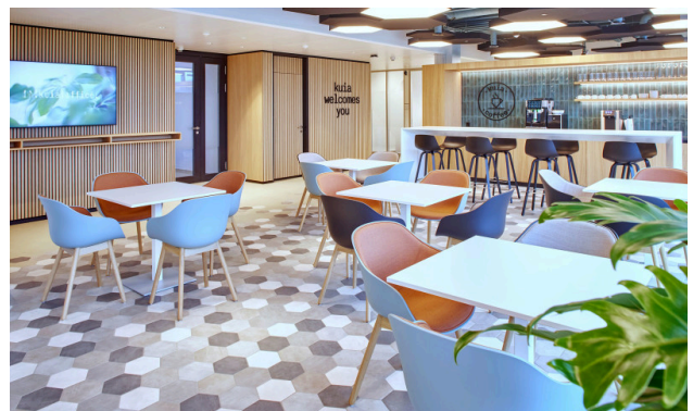
Coffee Corner mit Blick auf den Zugersee