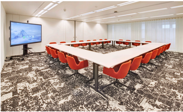
Meeting-/Workshopraum für 24 Personen