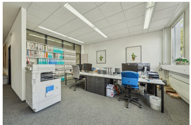
Empfang- und Bürobereich EG