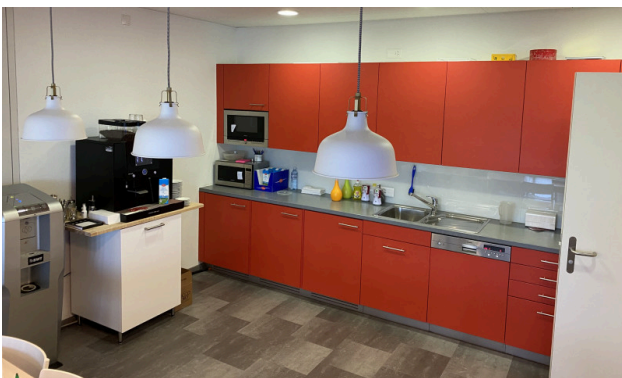
Teeküche und Aufenthaltsraum