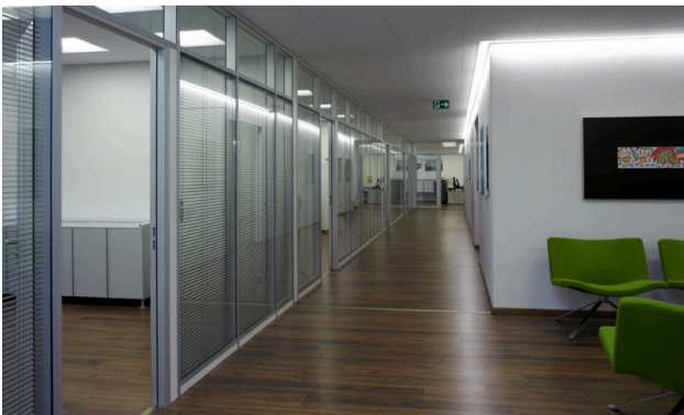
Korridor mit Glaswänden