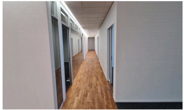
Korridor mit LED-Beleuchtung