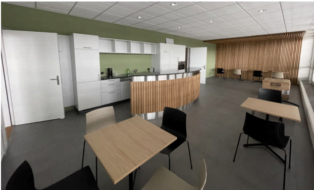
Teeküche im Aufenthaltsbereich