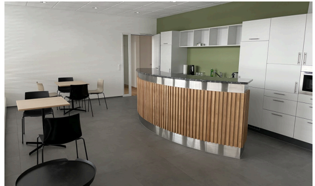
Teeküche im Aufenthaltsbereich