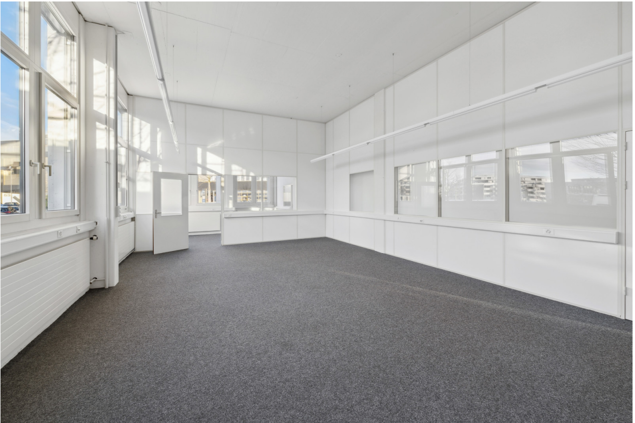
Grossraumbüro / Ausstellungsfläche