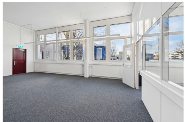
Grossraumbüro / Ausstellungsfläche mit Verbindungstüre