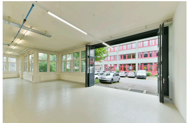
Ansicht Nutzfläche mit Sektionaltor