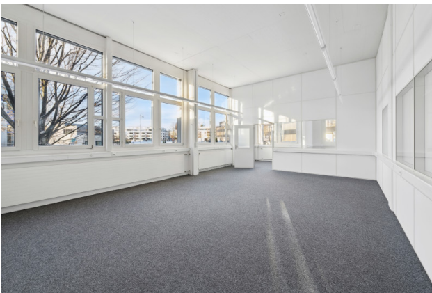
Grossraumbüro / Ausstellungsfläche