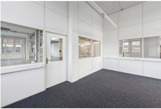
Büro mit Zugang Lager / Produktion