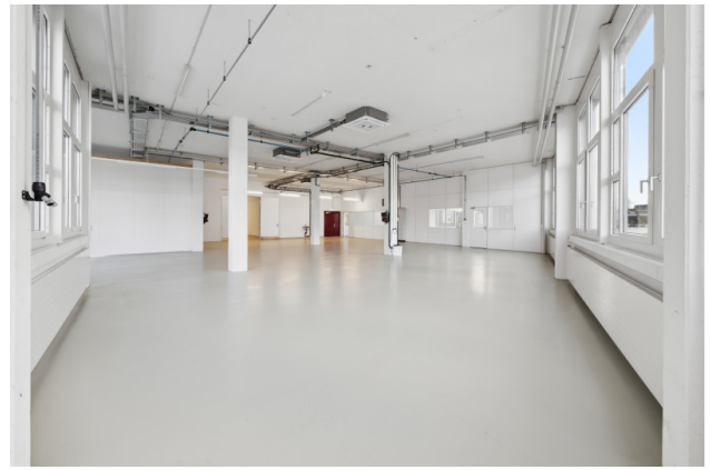
Lager / Produktion