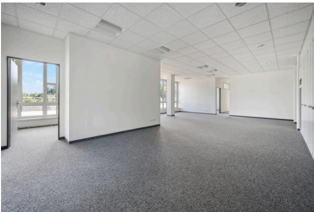
Eingang / Empfangsbereich