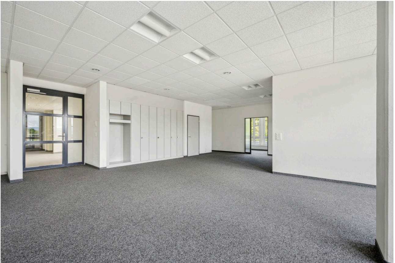
Eingang Bürofläche mit Einbauschränken