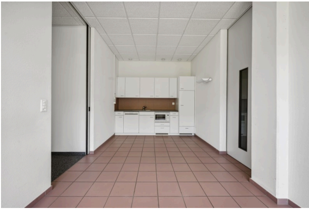
Küche / Aufenthalt