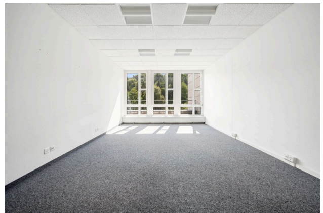
Büro 1 / Sitzungszimmer